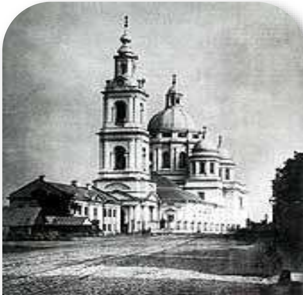
Елоховский собор, в котором крестили А.С.Пушкина