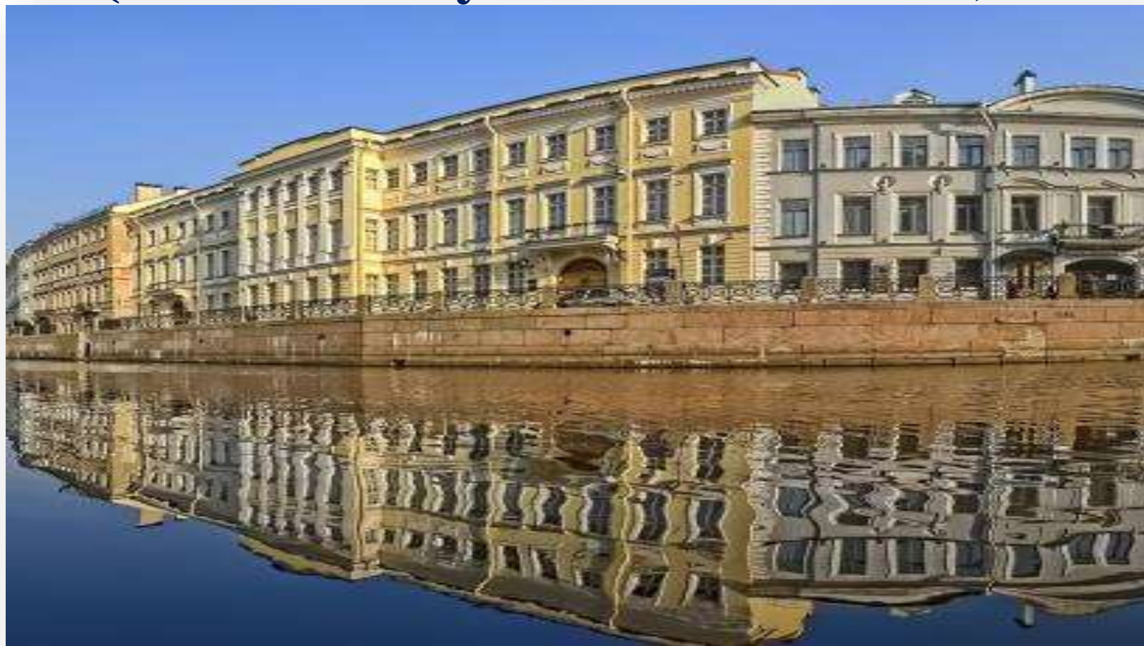
Дом на набережной реки Мойка