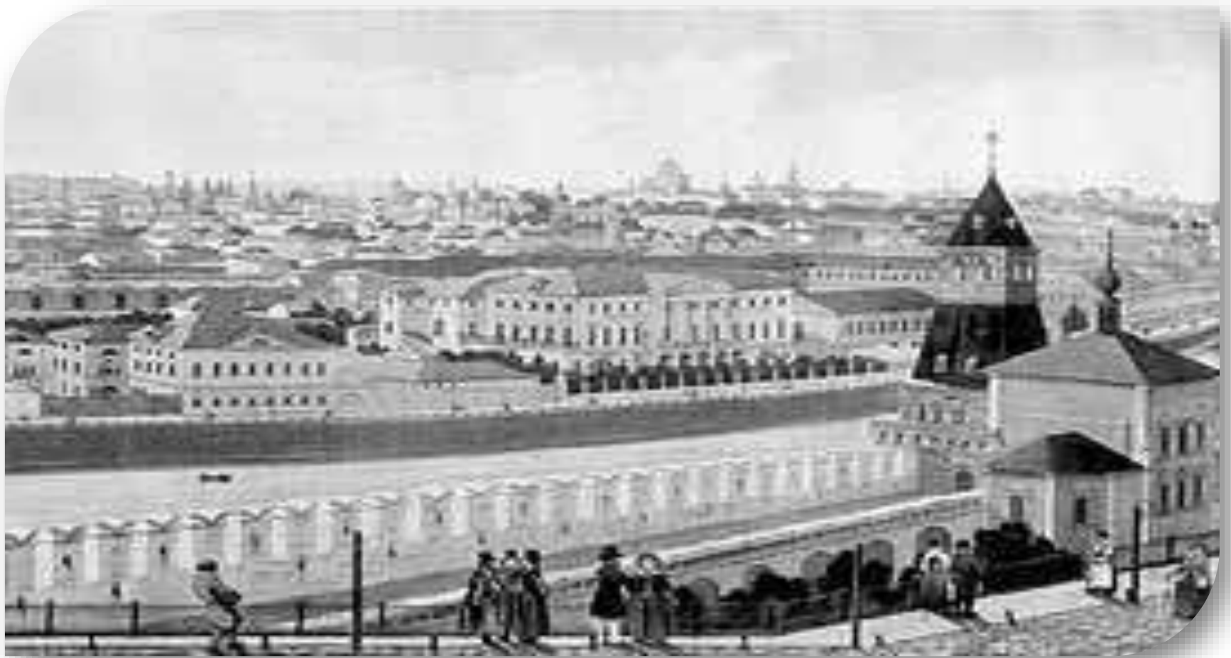
Вид части города с Кремлевской стены