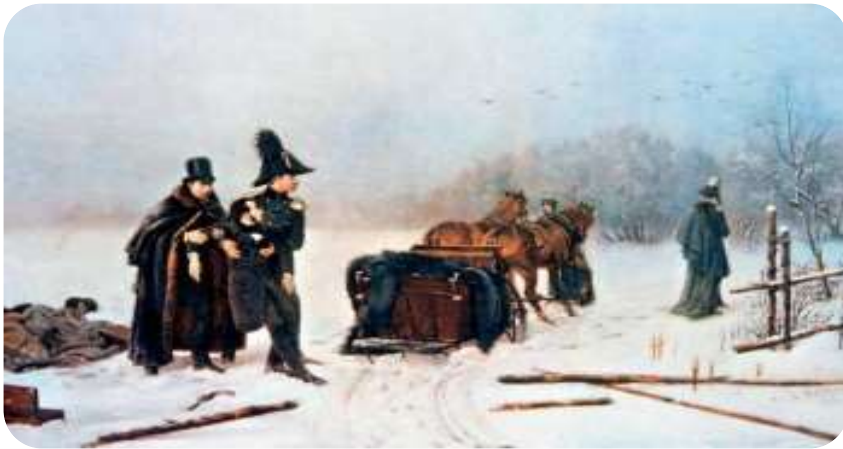
Дуэль Пушкина с Дантесом. (художник А.Наумов), 1885