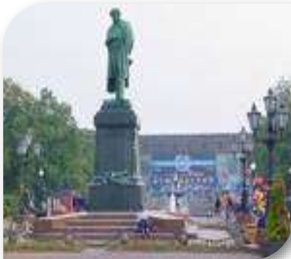
Памятник А.С.Пушкину в Москве (скульптор А.М.Опекушин)