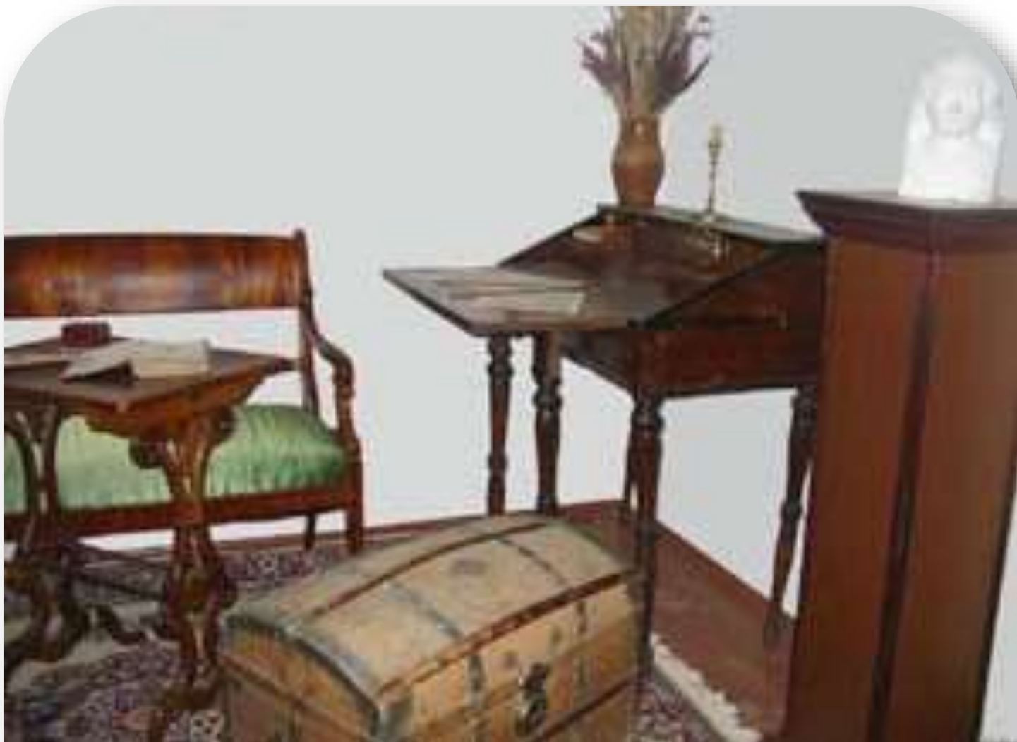
подлинная мебель конца XVIII и середины XIX века из имения Ганнибала