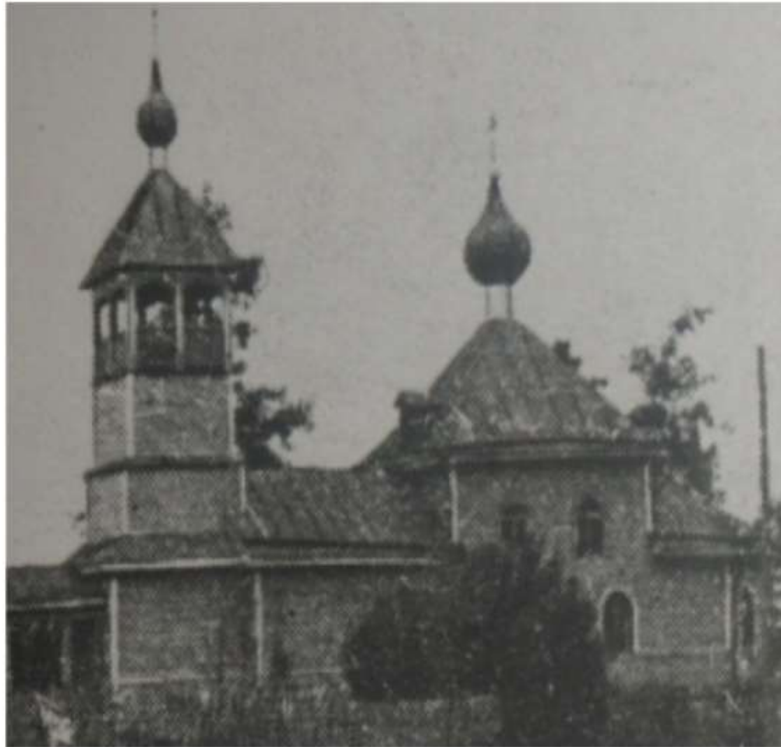
Храм Воскресения Христова в Суйде, где венчались родители Александра Сергеевича Пушкина