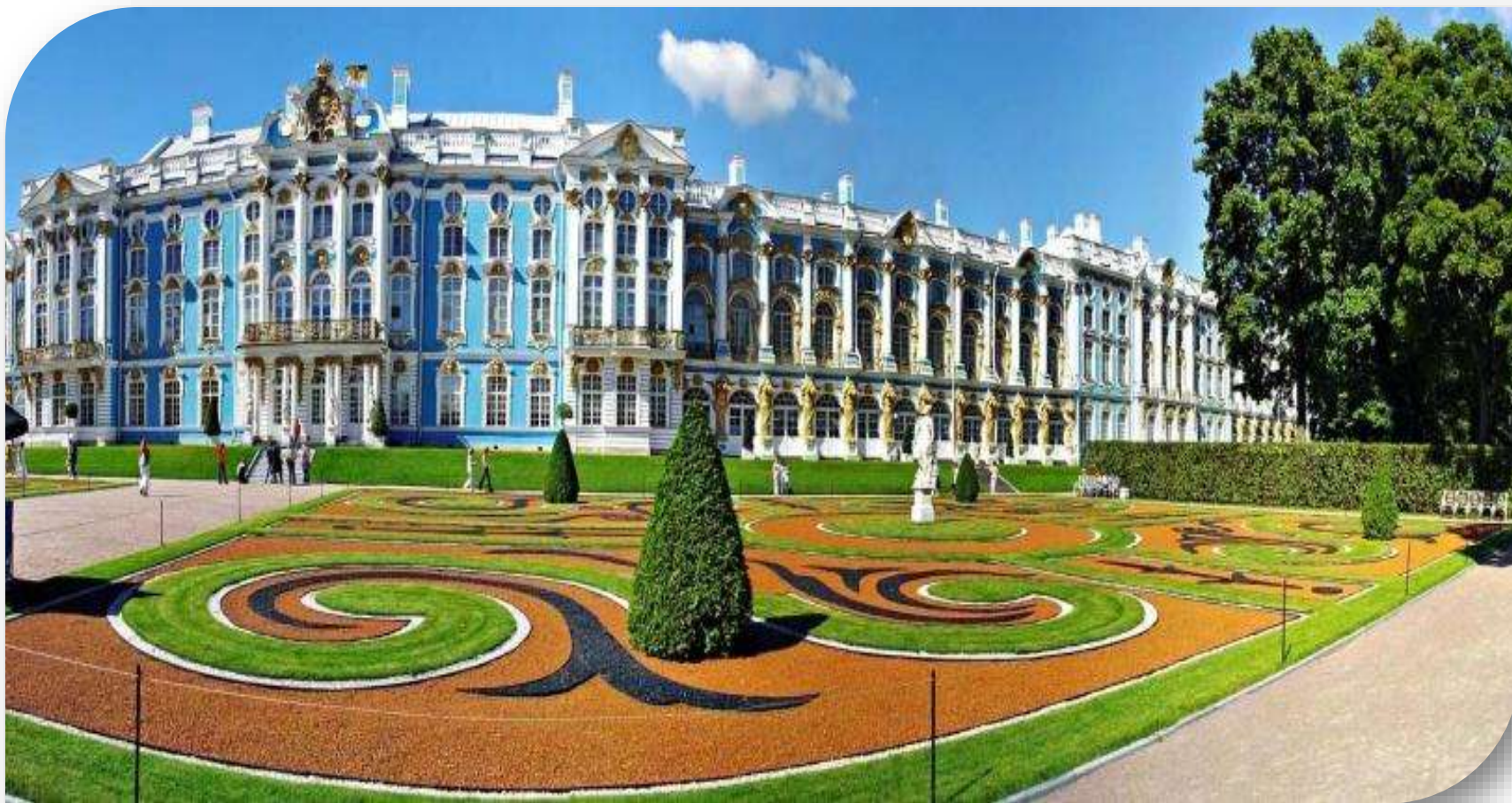
Петербург. Царское Село