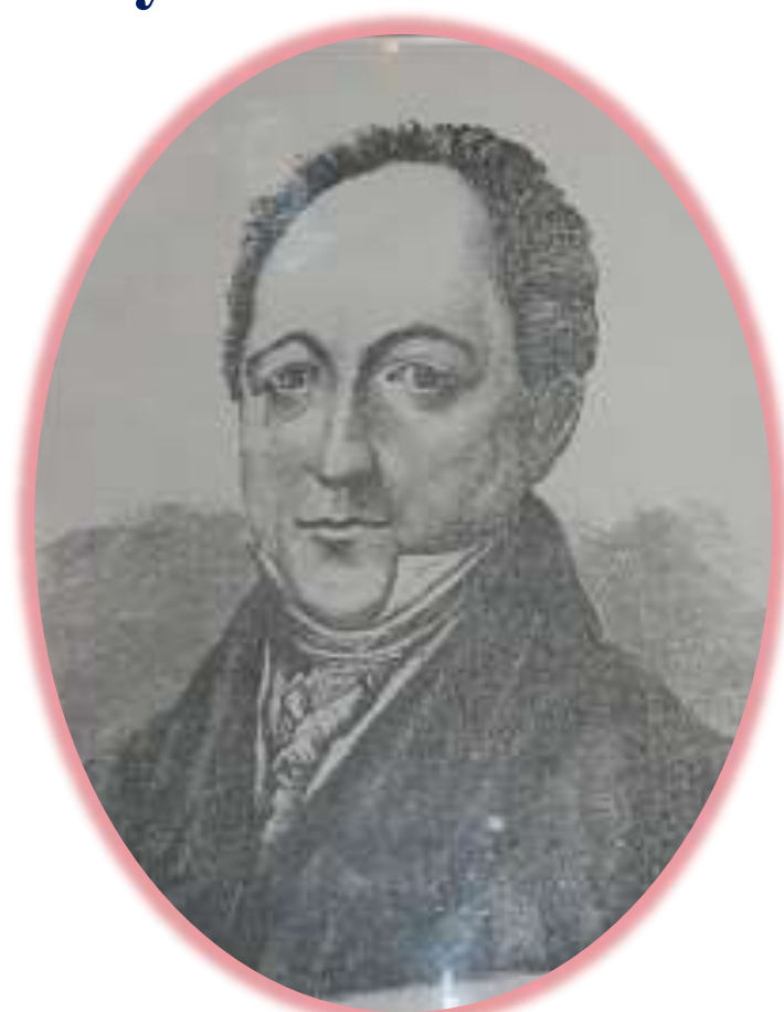
Сергей Львович Пушкин