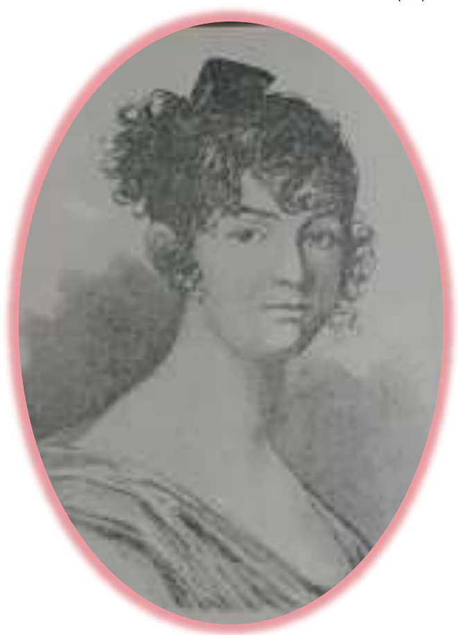
Надежда Осиповна Ганнибал