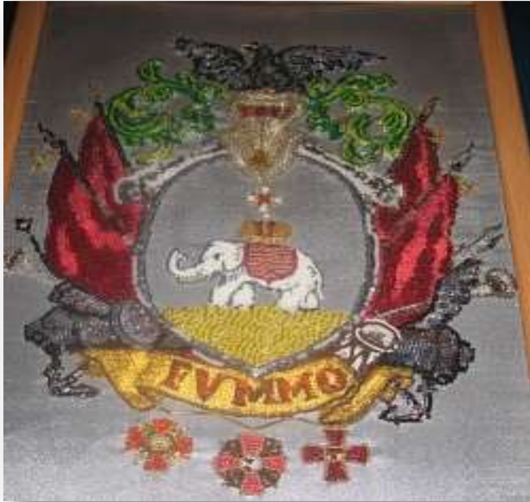
Герб А.П. Ганнибала