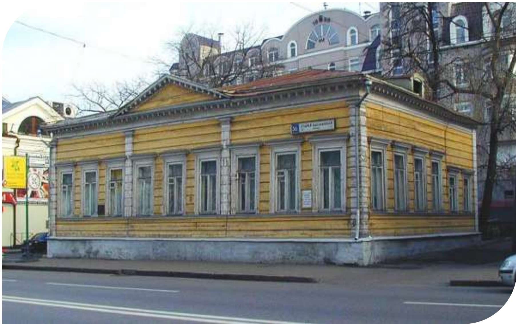
Дом-музей Пушкиных в Москве