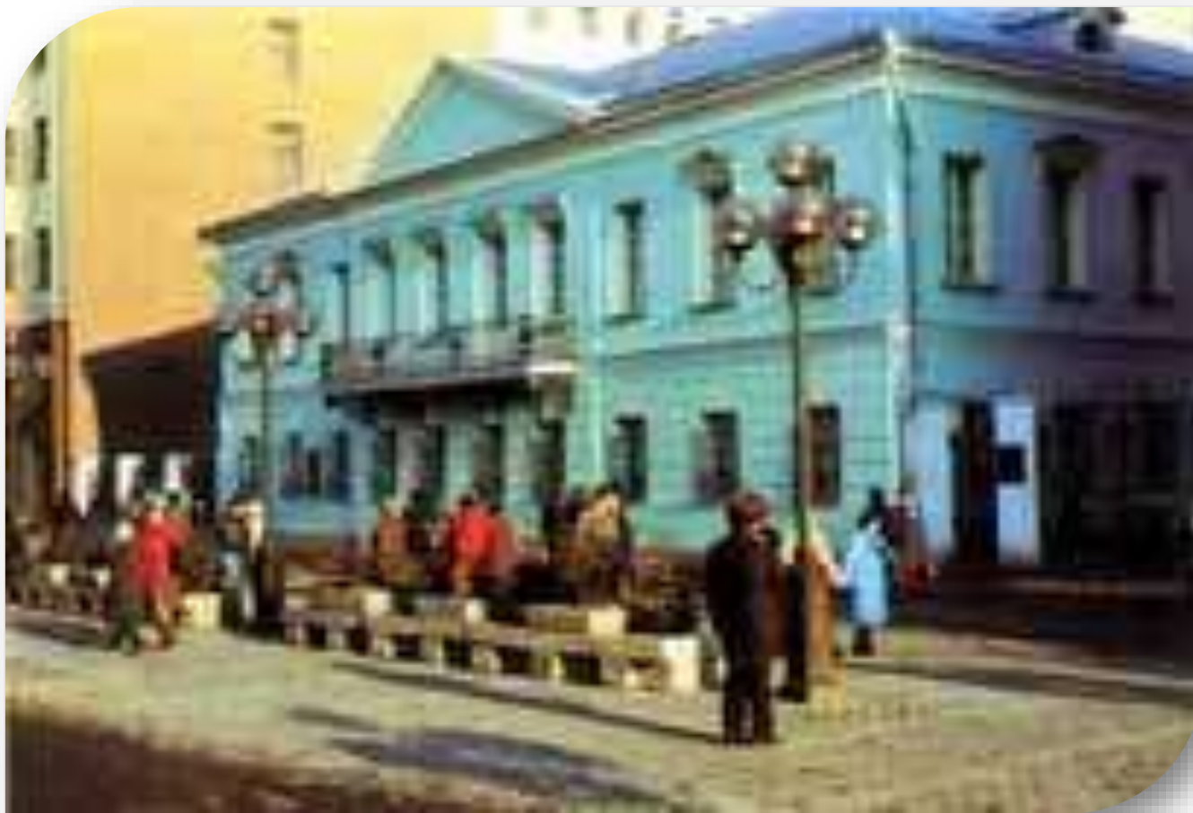
Квартира А.С.Пушкина на Арбате