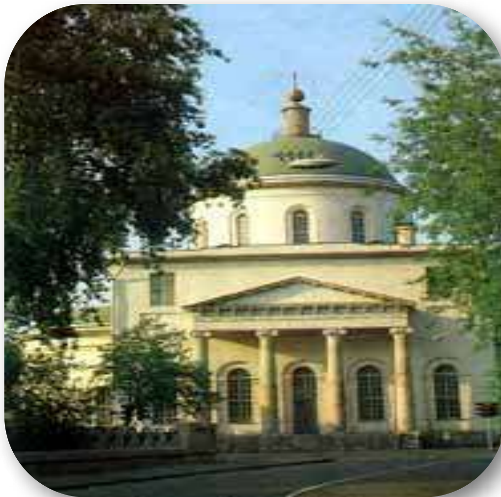
Храм Вознесения, где венчался А.С.Пушкин с Н.Н.Гончаровой