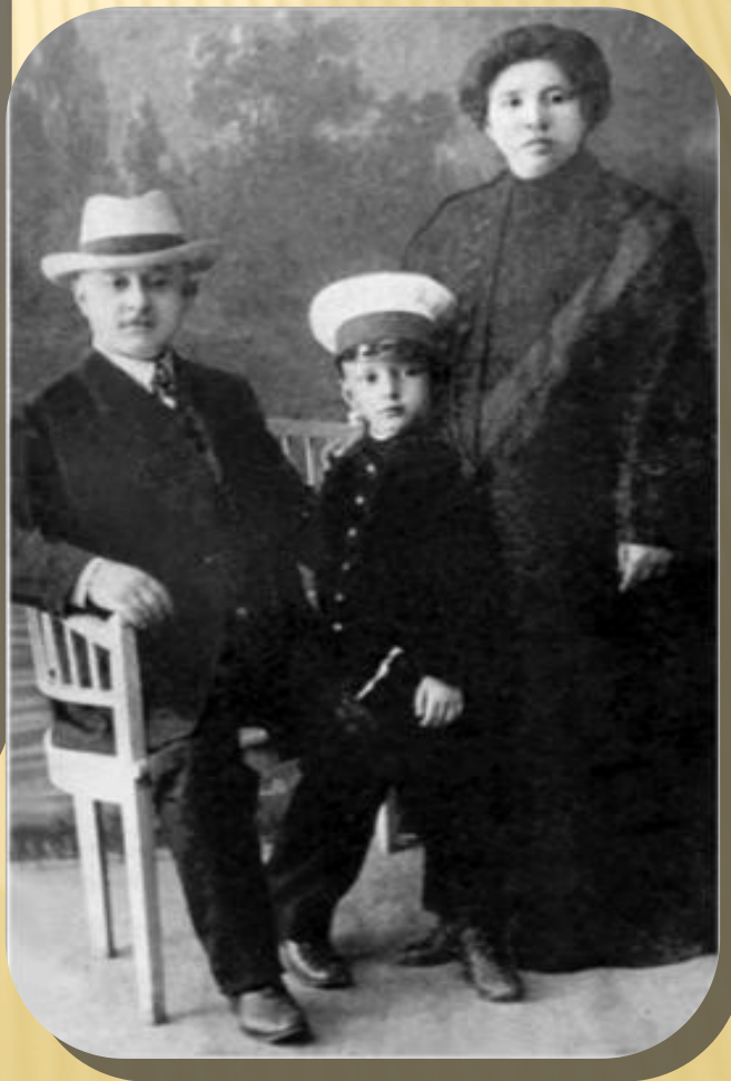
Михаил Шолохов с родителями