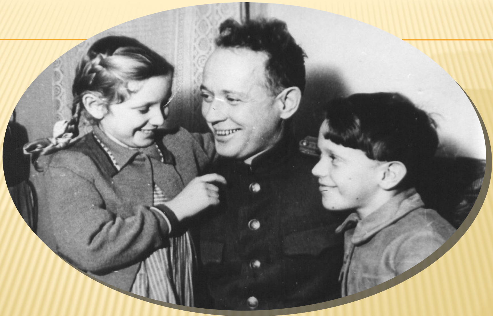
М.А.ШОЛОХОВ С ДЕТЬМИ МАШЕЙ И МИХАИЛОМ 1946 ГОД