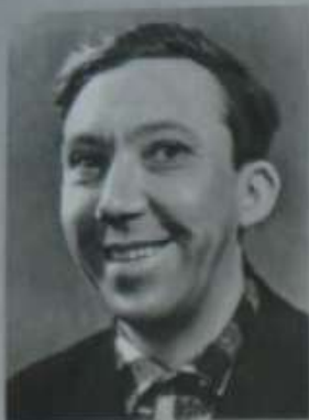
Юрий Владимирович Никулин

Великий русский актер. Всемирно любимыми стали фильмы с участием Никулина –