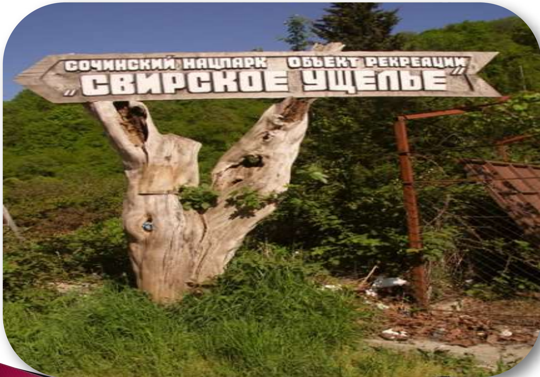
Свирское ущелье – прекрасный уголок Лазаревского района