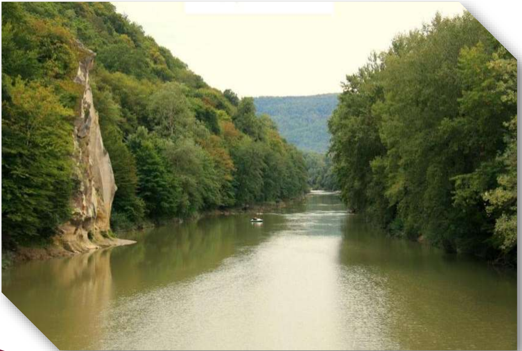
Река Псекупс. Кавказ.