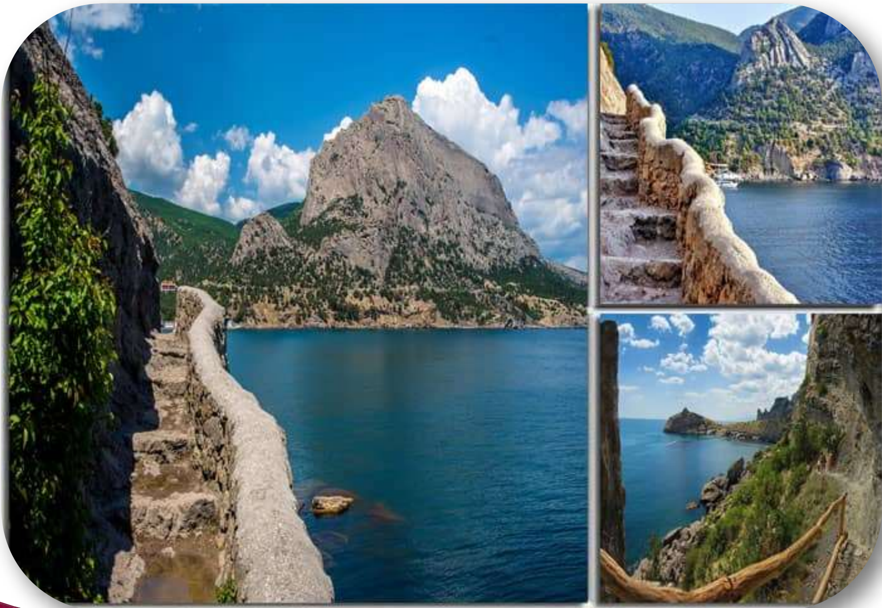
Тропа Голицына, Крым