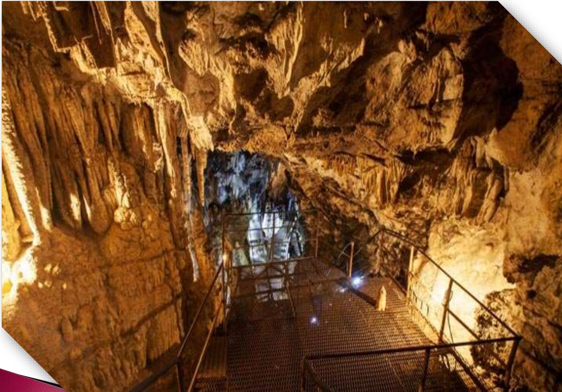
Большая Азишская пещера