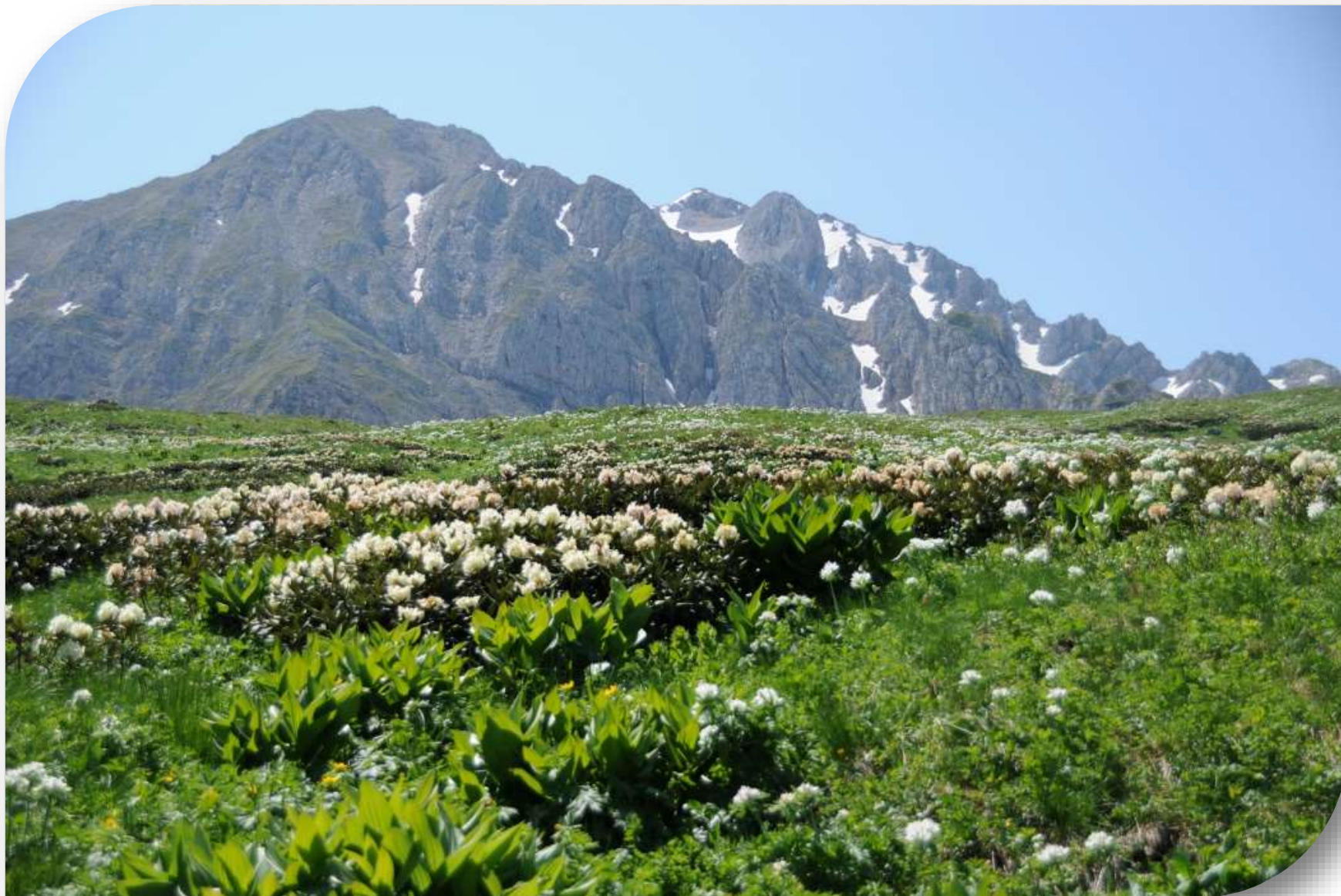
Рододендроны в горах