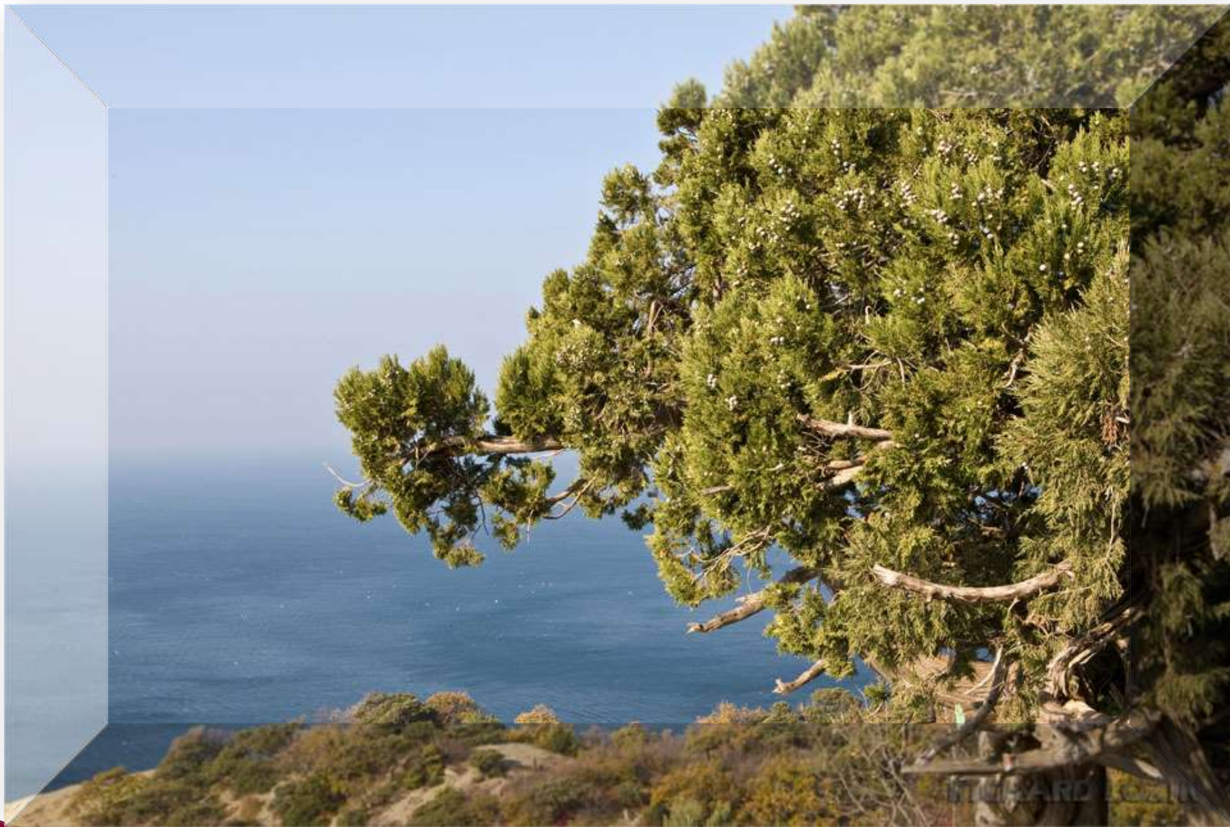
Чёрное море у Большого Утриша