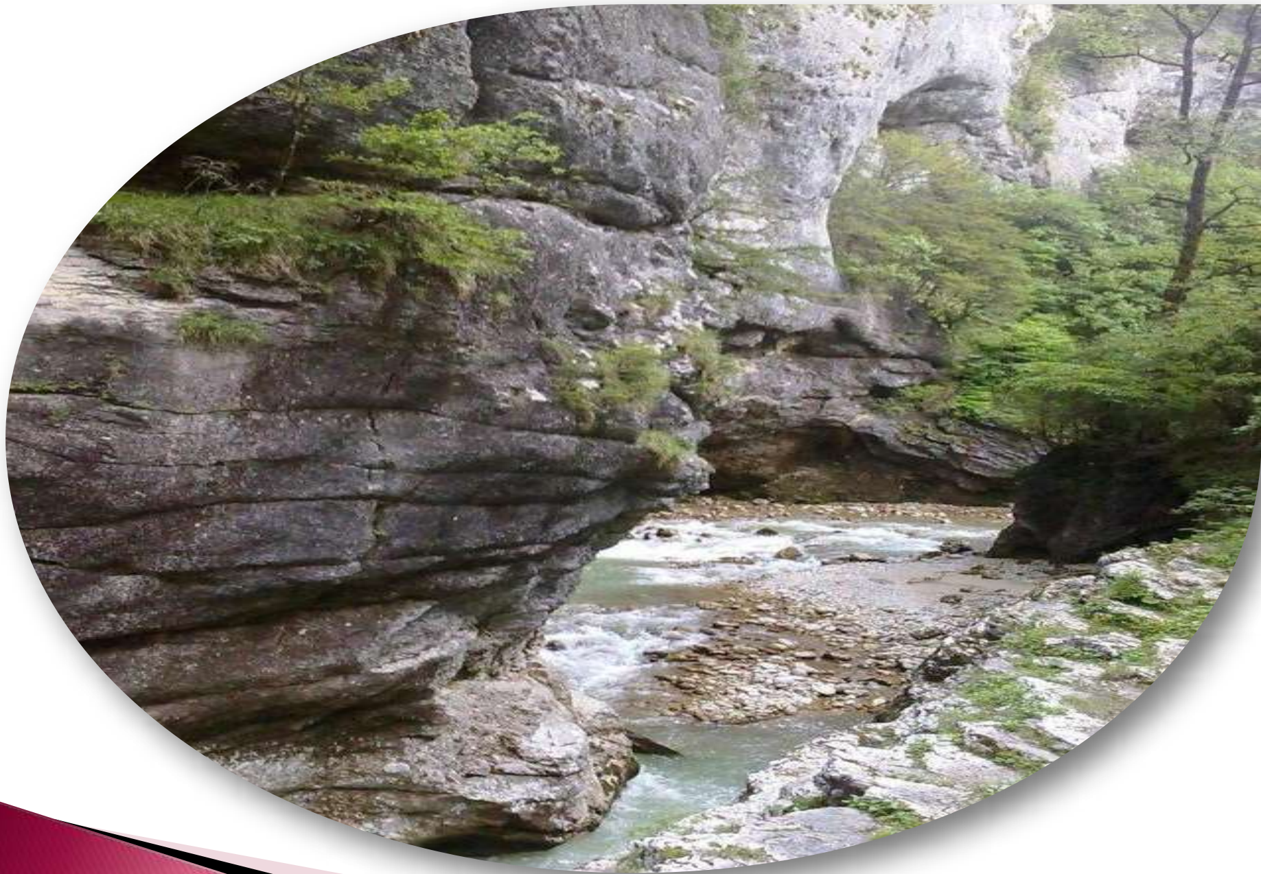
Река Курджипс. Гуамское ущелье. Кавказ