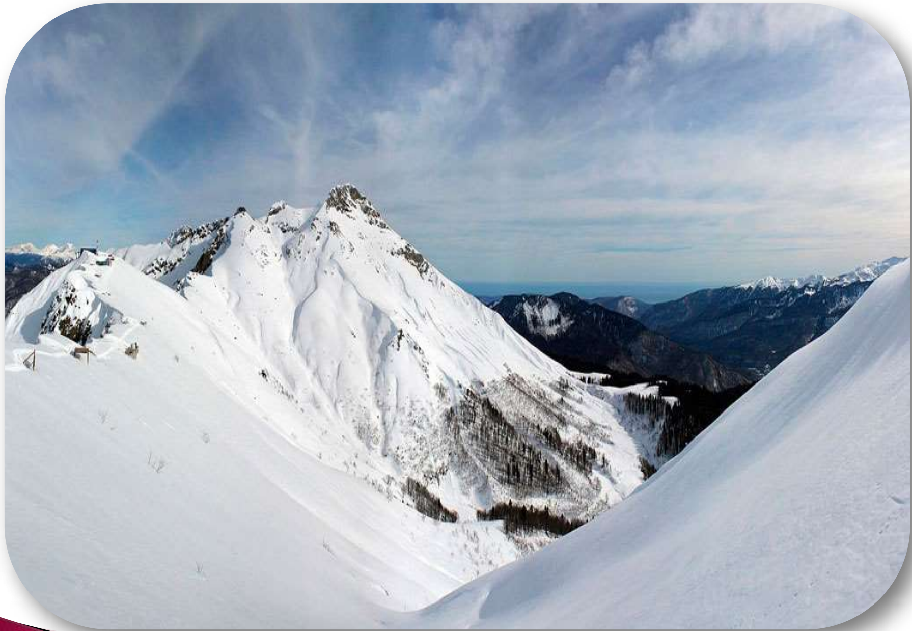
Красная поляна. Сочи