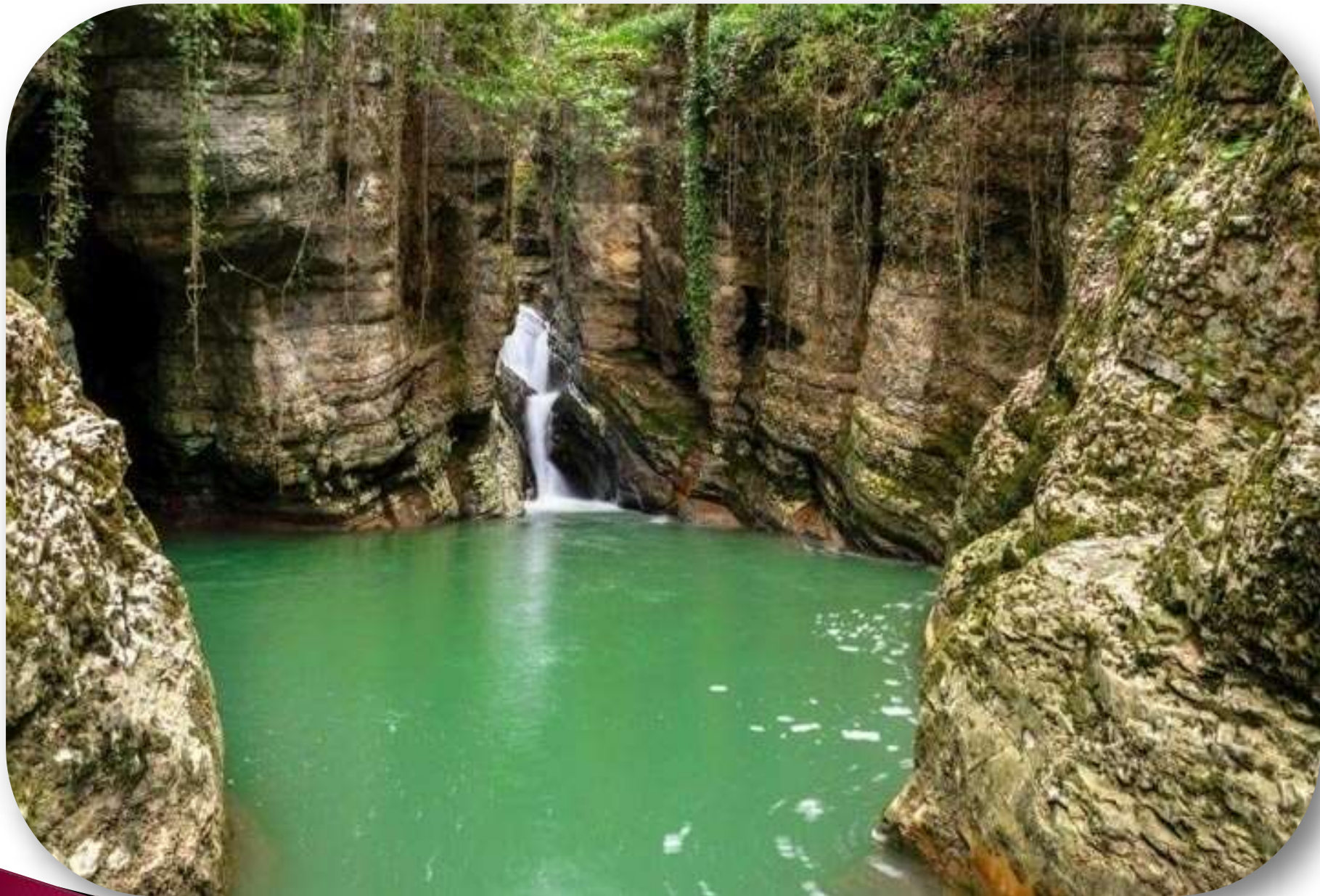
Агурские водопады – одного из самых красивых мест в Краснодарском крае