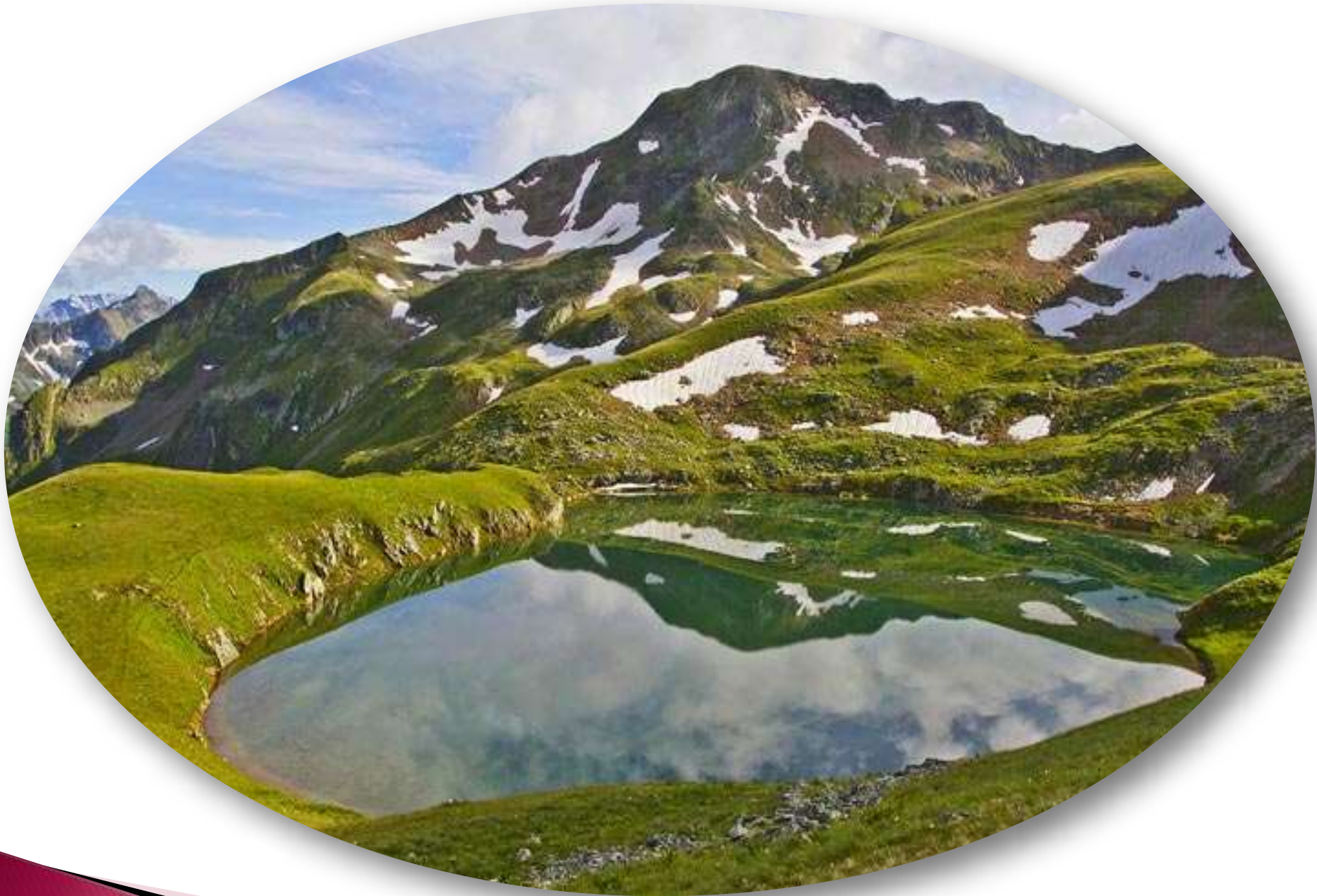
Кавказский государственный биосферный заповедник (создан в 1924 году)