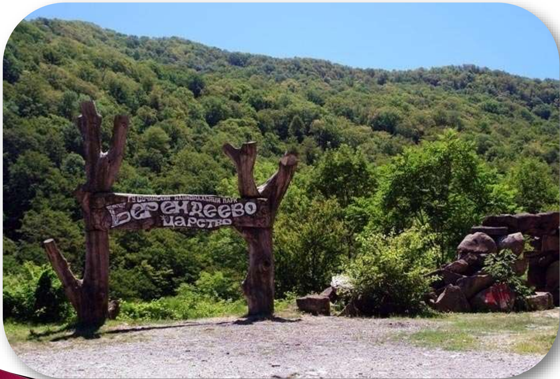
Парк «Берендеево царство»