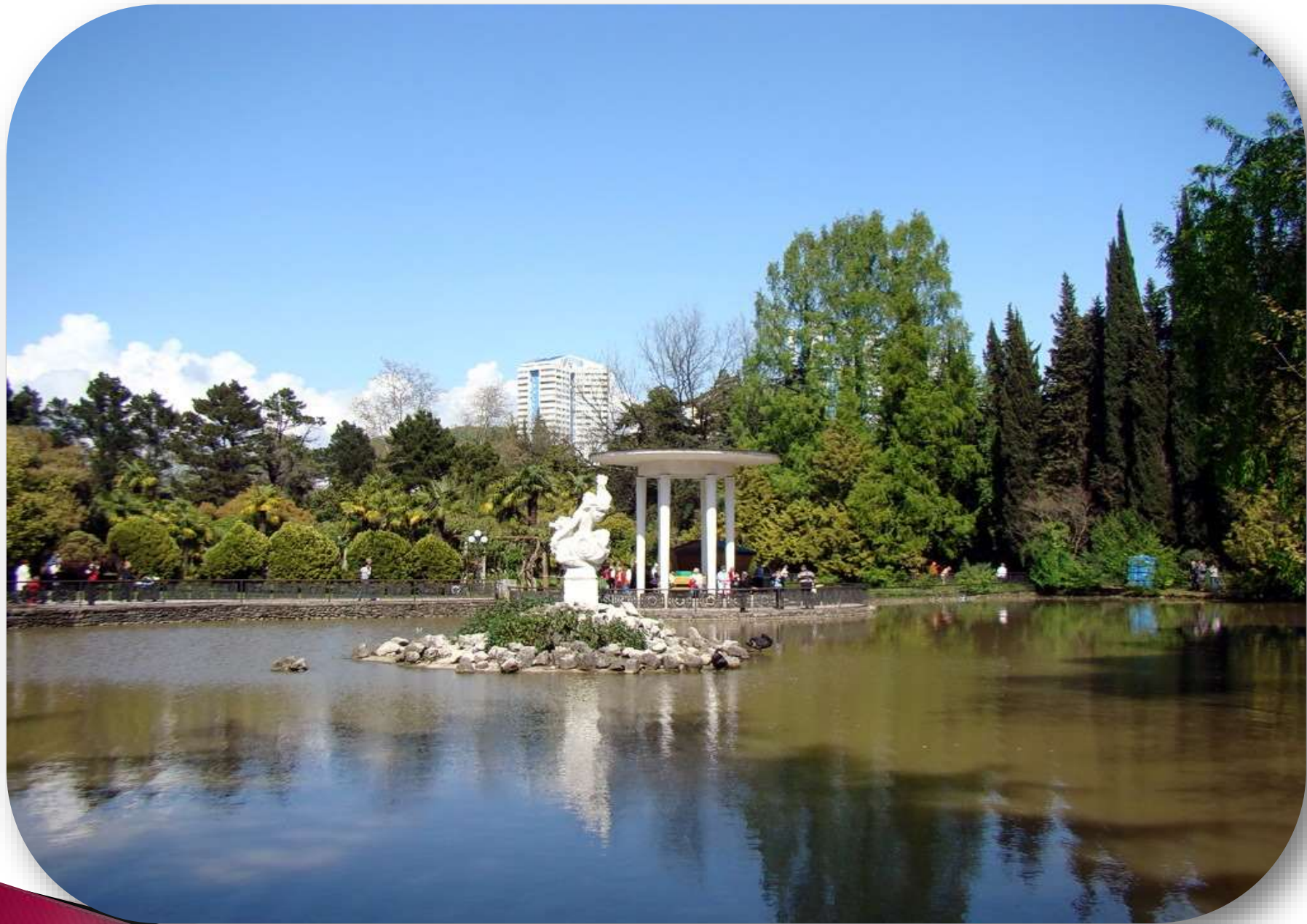
Пруд в Сочинском дендрарии