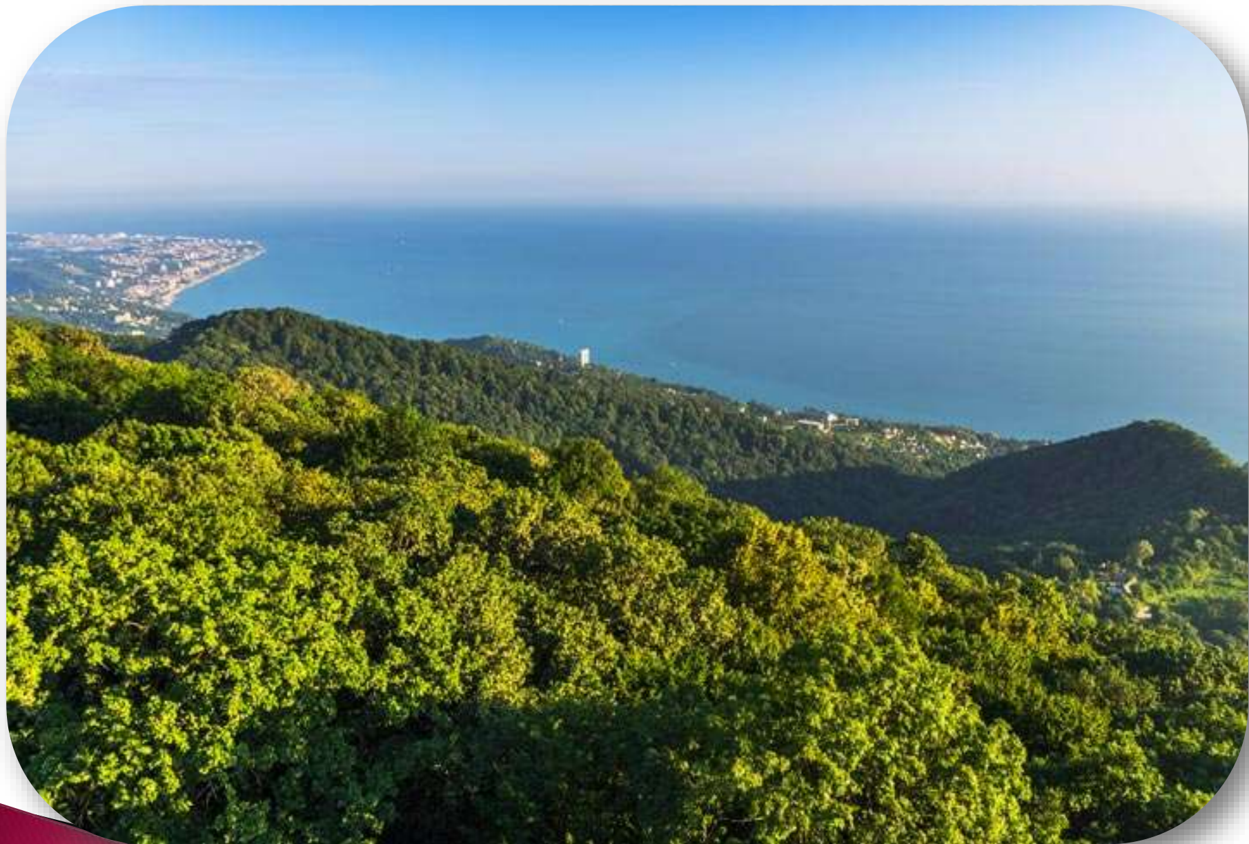
Гора Большой Ахун в Сочи