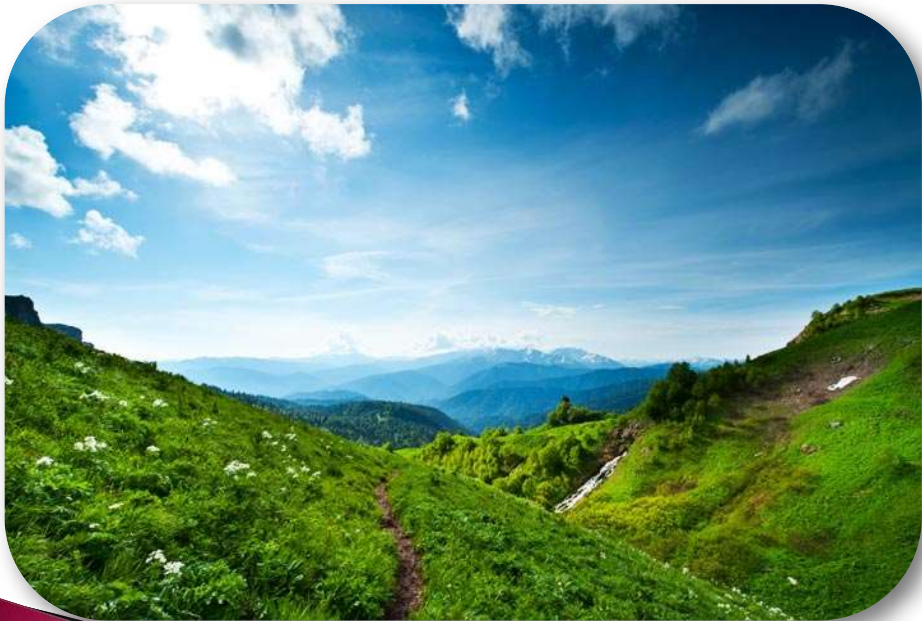
Горное плато Лаго-Наки