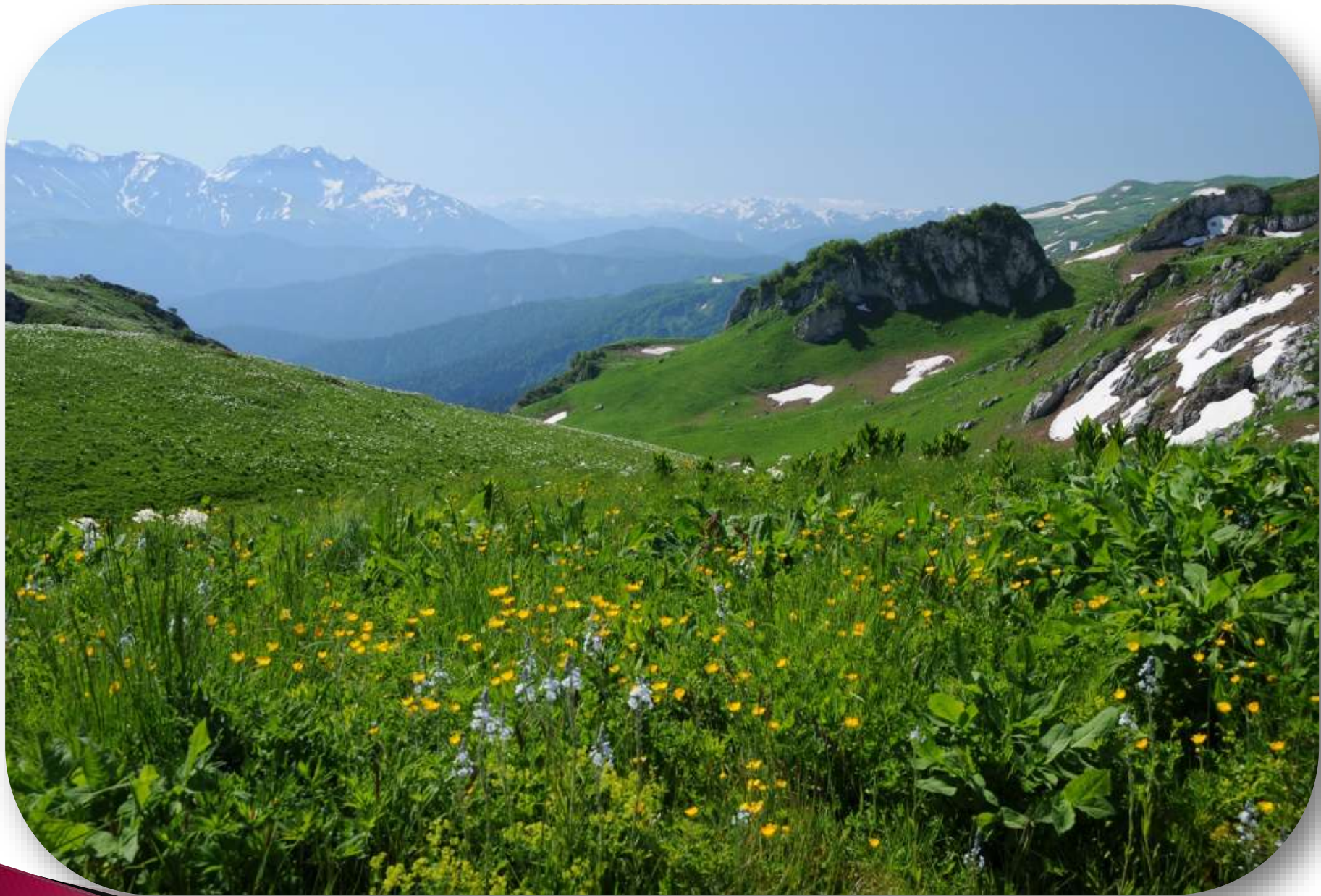
Горный пейзаж. Адыгея