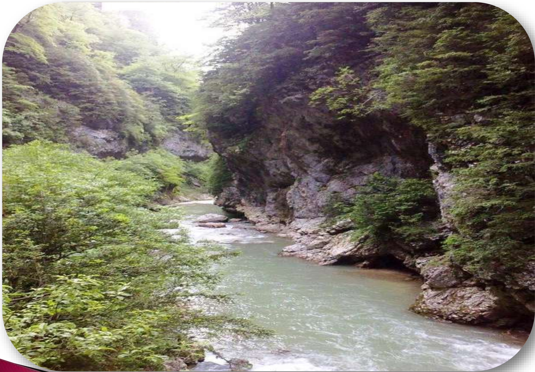
Река Курджипс. Гуамское ущелье. Кавказ