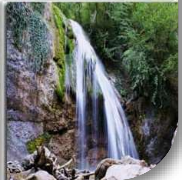
Водопад Джур-Джур в Крыму