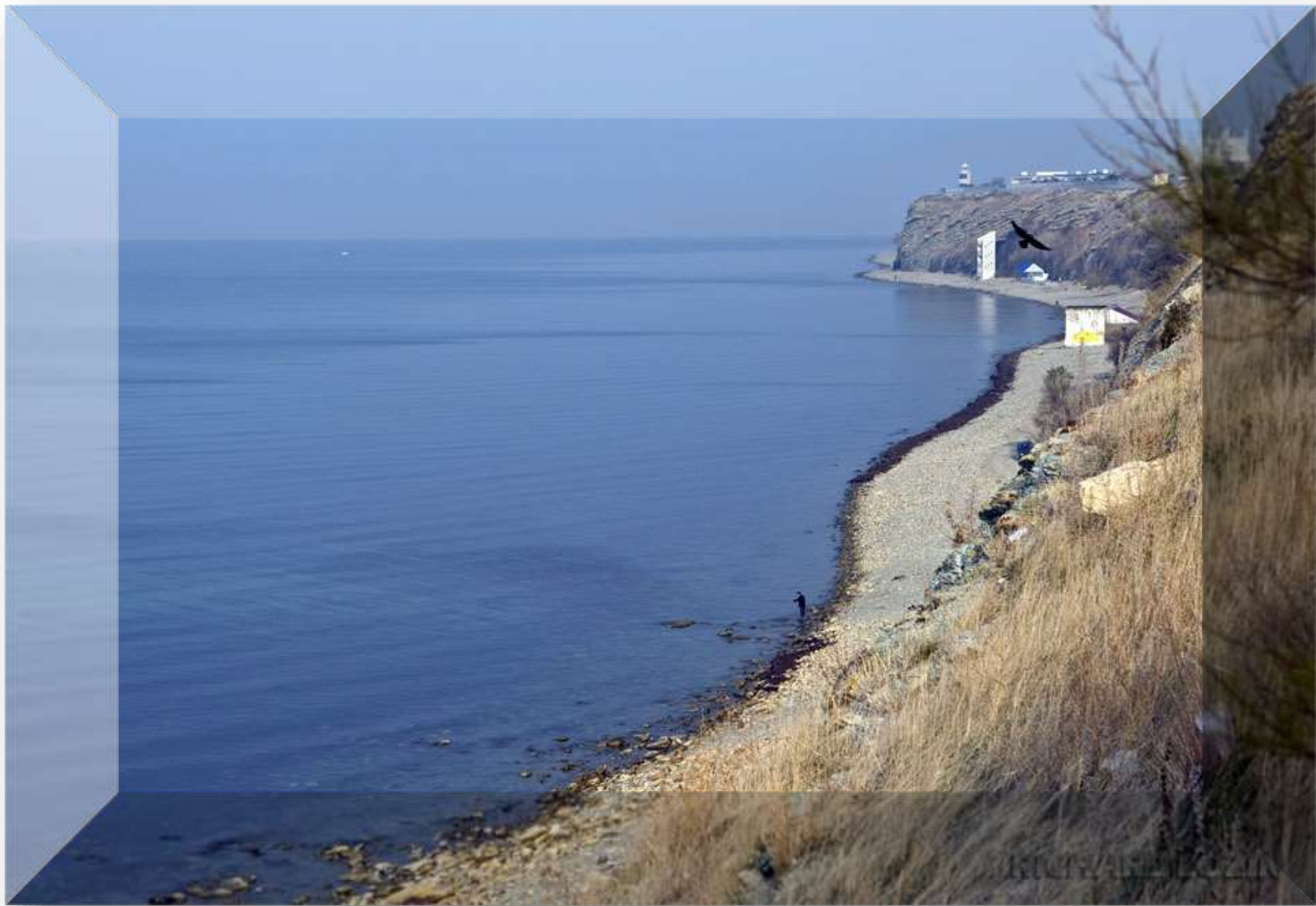
Анапа. Высокий берег