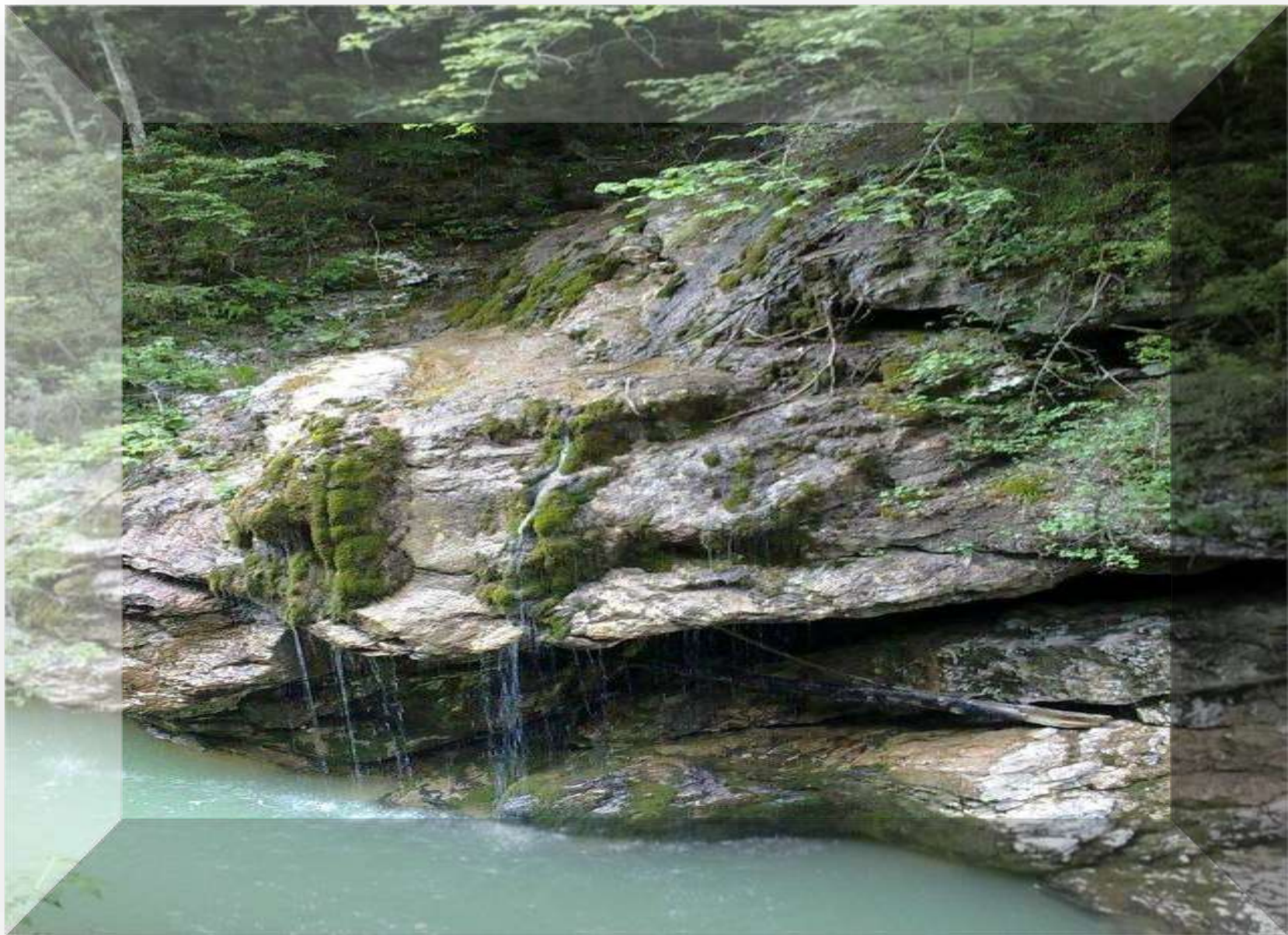
Река Курджипс. Гуамское ущелье. Кавказ