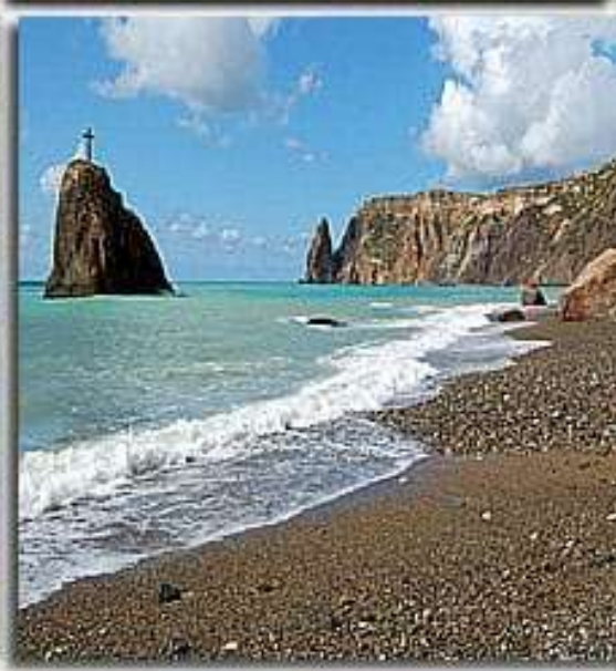
Мыс Фиолент, Крым: загадочный край земли