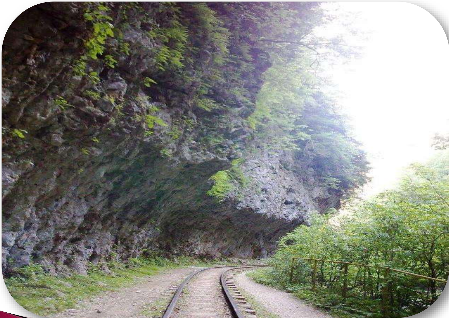
Гуамское ущелье. Кавказ.