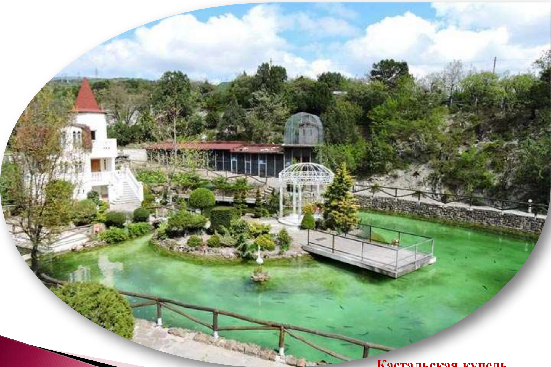
Кастальская купель (находится на окраине Кабардинки)