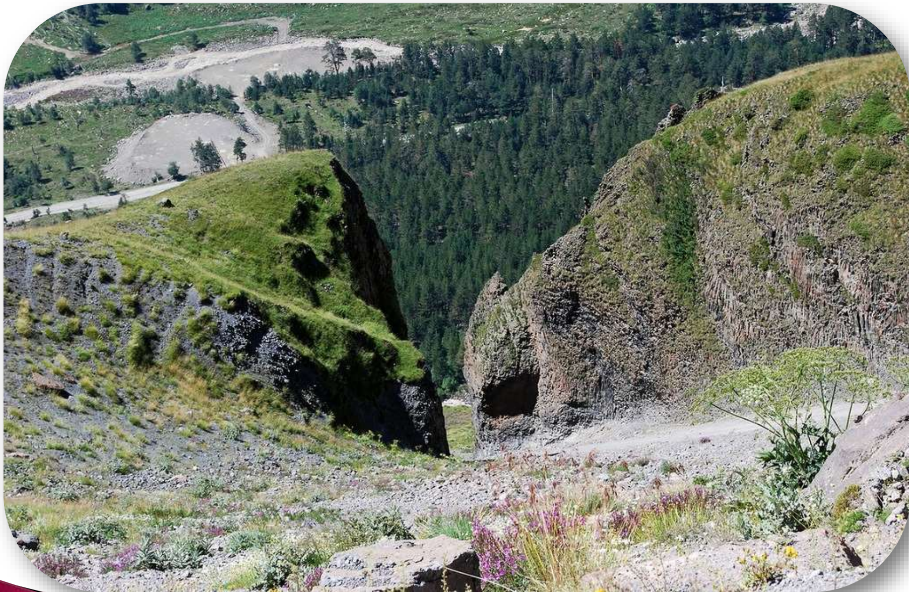
Ущелье "Волчьи ворота". Туапсе