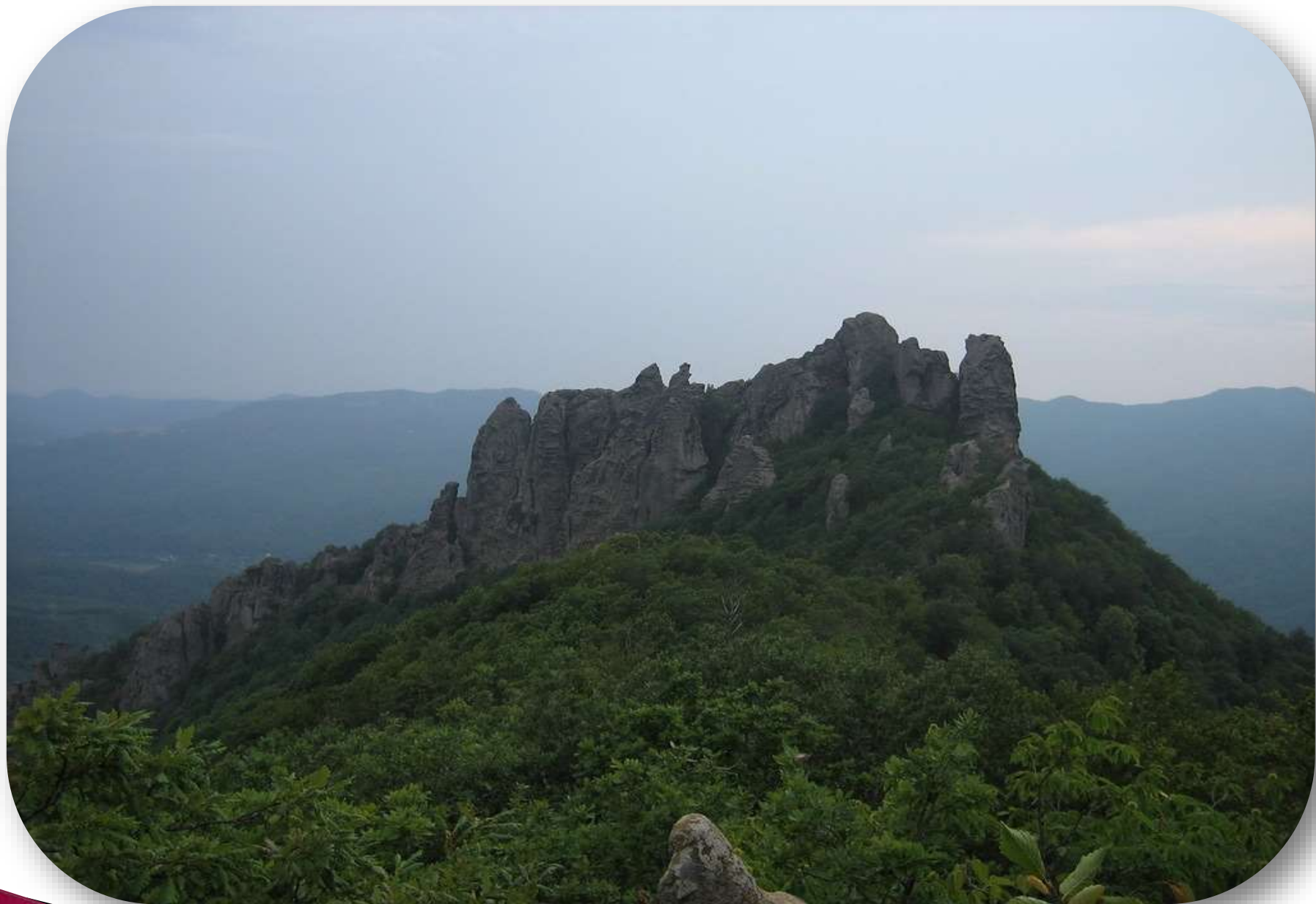
Гора Индюк, затянутая грозowymi облаками. Туапсе