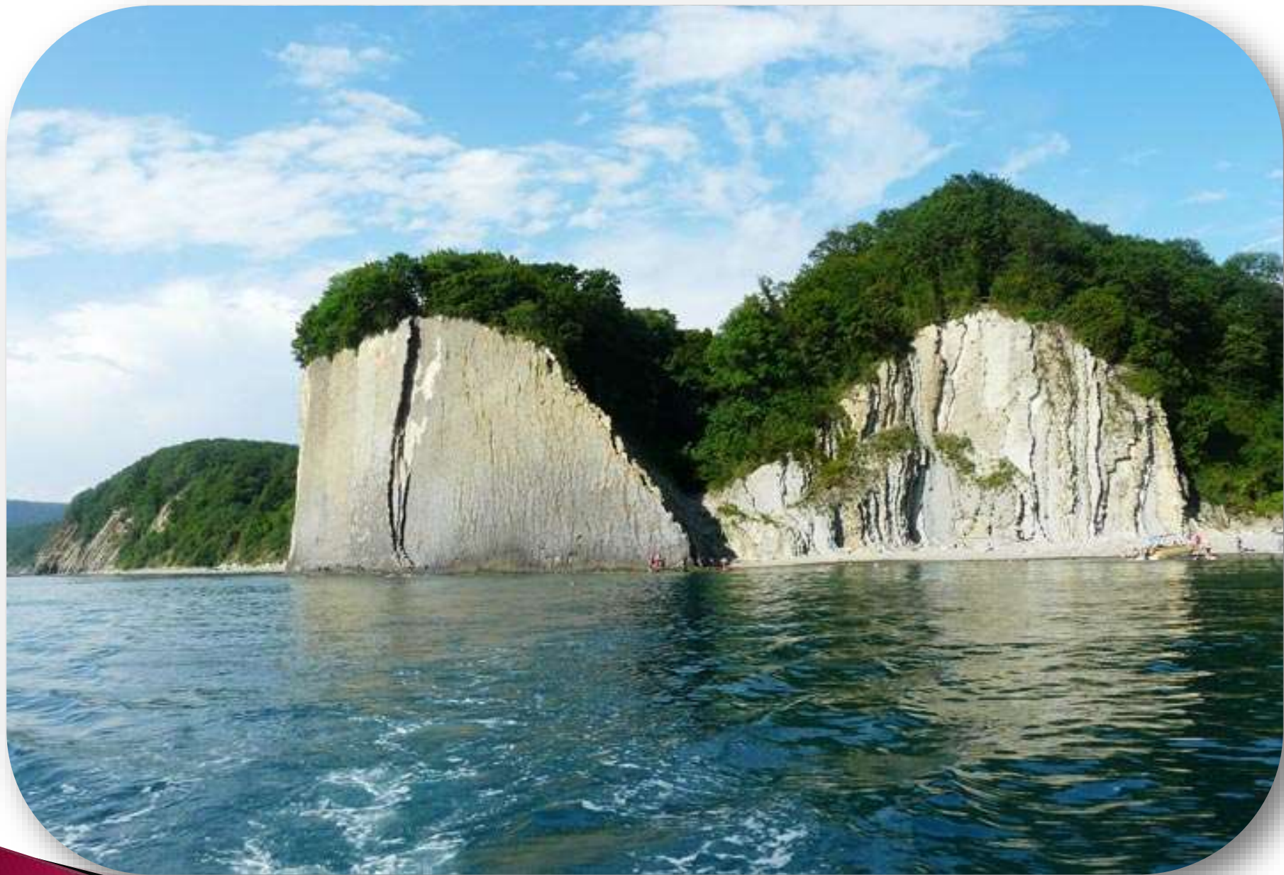
Скала Киселева – визитная карточка города Туапсе