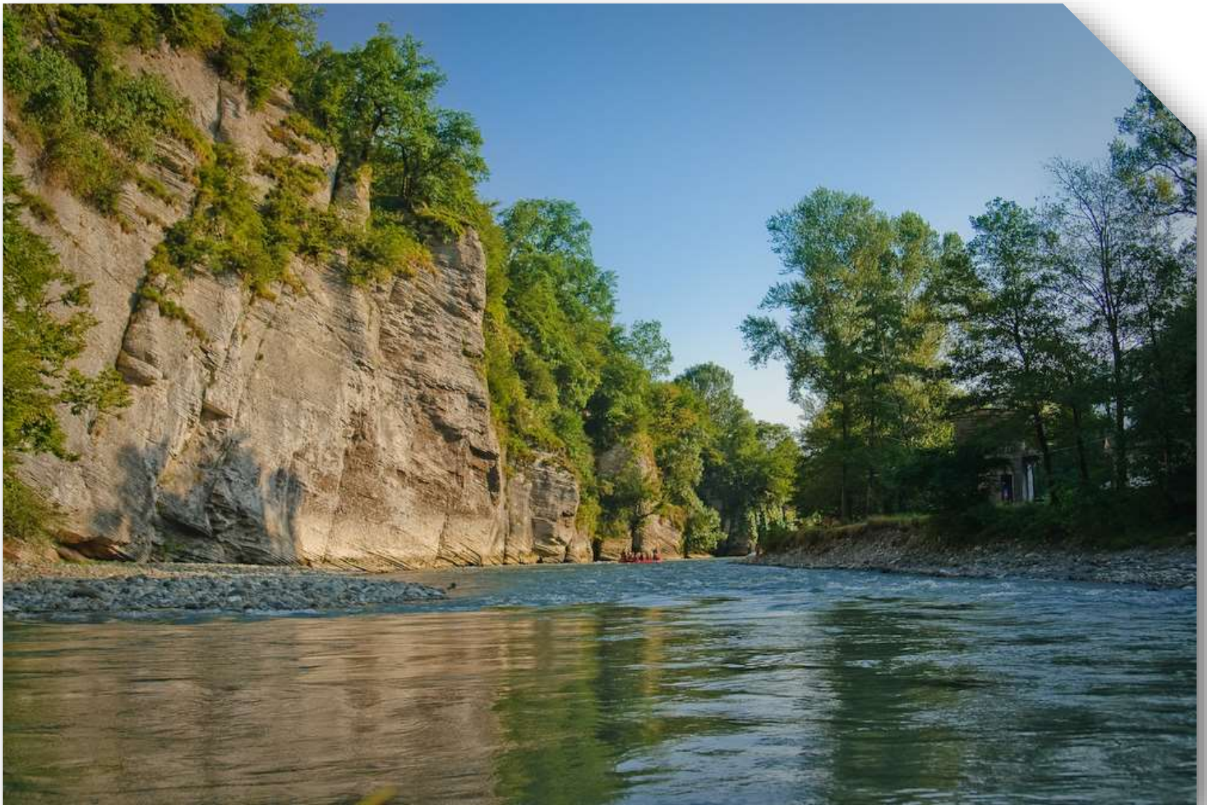
Река Мзымта в районе Большого Сочи