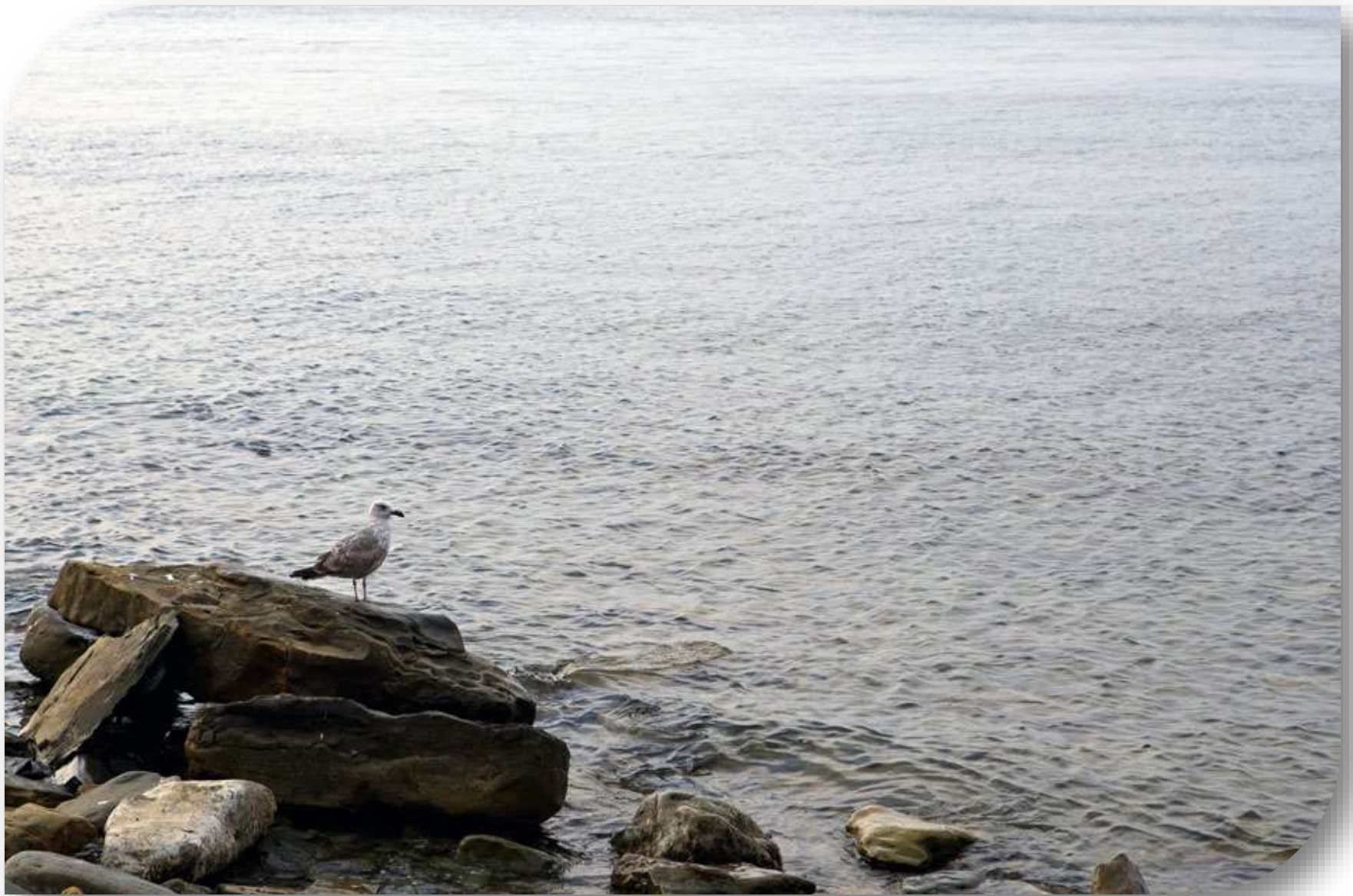
Анапа, Берег моря