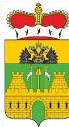
Сокращённая версия герба Краснодарского края с княжеской шапкой ("средний" герб)