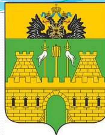
Герб Краснодарского края без внешних украшений (малый герб)

Законодательством Краснодарского края не предусмотрено использование каких-либо сокращённых версий герба края, но общие геральдические правила, действующие в России, позволяют использование любого герба без всех или части внешних украшений. На этом основании для герба Краснодарского края возможны несколько сокращённых версий: