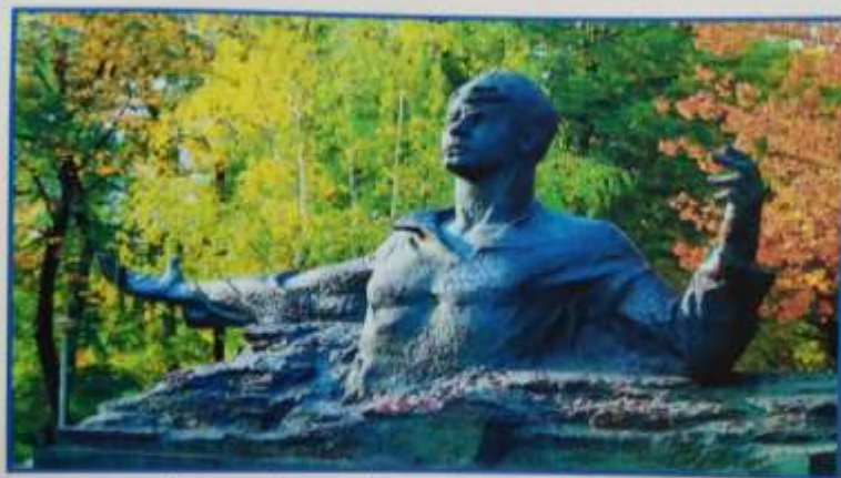
Памятник Пушкину в Рязани. Скульптор А. Кибальников

Памятник Есенину в Рязани. Скульптор А. Кибальников.- //Лит. в школе.-2009.-№7.- С.49.