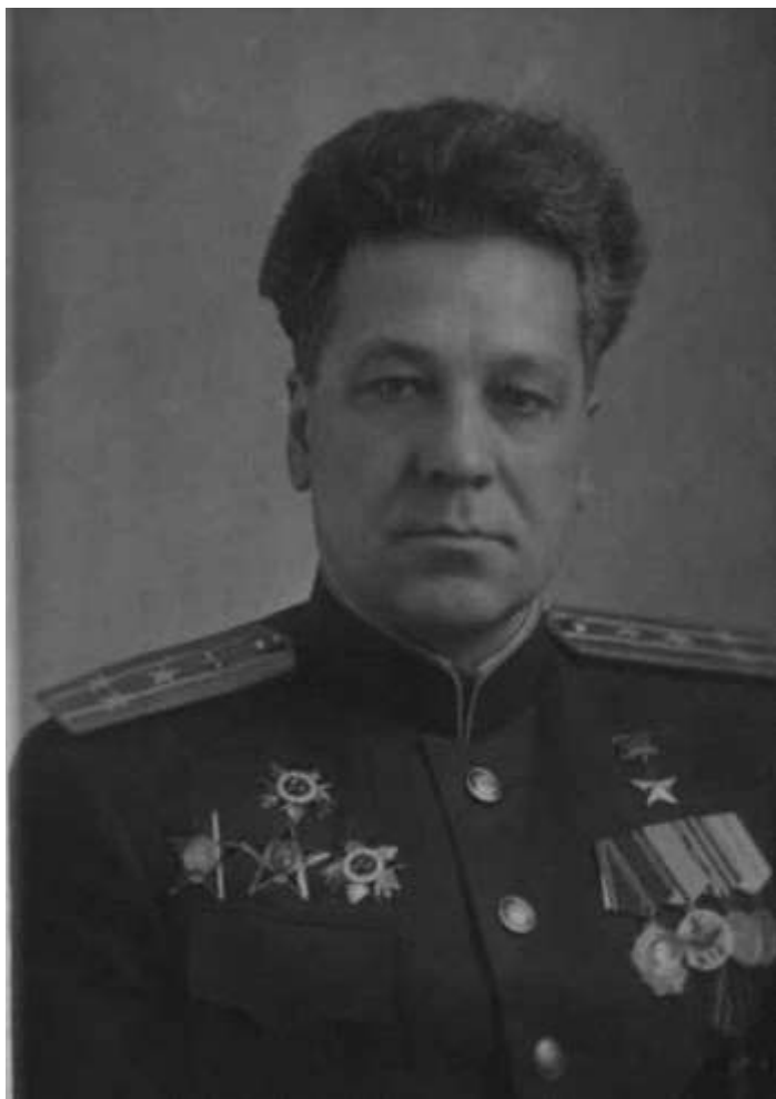
Ляпидевский Анатолий Васильевич Летчик, полковник, Герой Советского Союза № 1

Бюст установлен на территории СОШ №1 ст. Старощербиновская