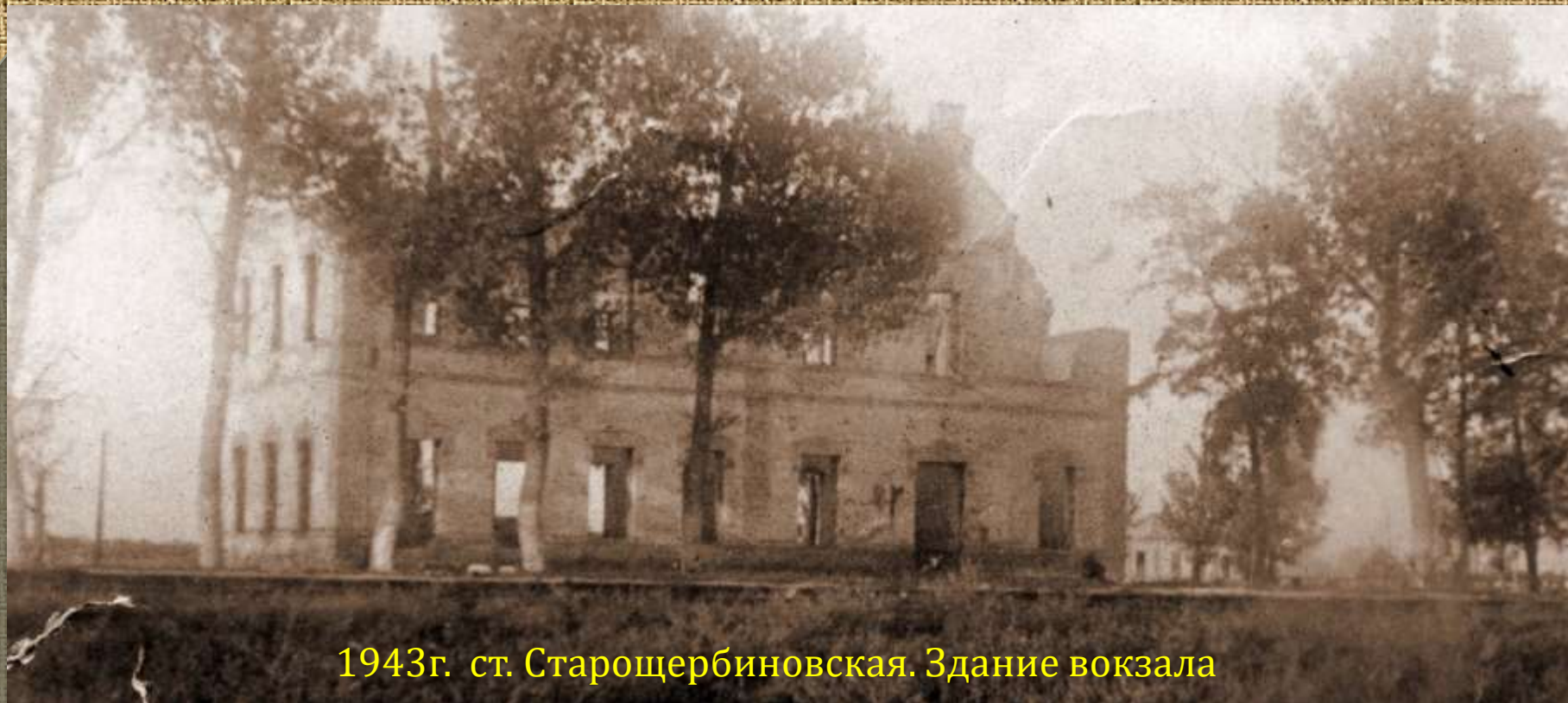
1943г. ст. Старощербиновская. Здание вокзала