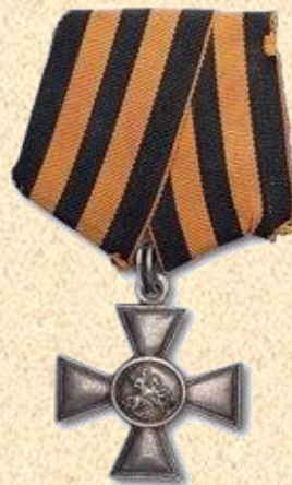
Орден Святого Георгия (Российская империя)

За всю историю лишь 25 военачальников были ею удостоены Георгиевской ленты, и только четверо из них были полными кавалерами ордена Святого Георгия всех четырех степеней — Михаил Кутузов, Михаил Барклай де Толли, Иван Варшавский и Иван Дибич Забалканский.