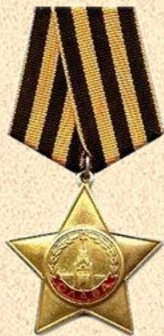
Орден Славы (СССР)

Возрождением доблестной Георгиевской ленты можно считать 1943 год, когда был учрежден Орден Славы для награды рядового состава Советской Армии за особые заслуги перед Родиной. Чёрно-оранжевый биколор «Дым и пламень» (или «Огонь и Порох») в виде ленты, еще называют «Гвардейской лентой», является знаком личной доблести солдата, проявленной им в бою. Двухцветный символ российских побед стал украшать самый почетный солдатский орден.