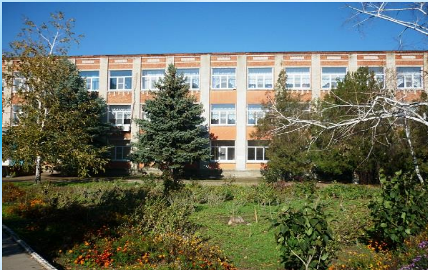
МБОУ СОШ № 11 им.Г.К.Кухаренко