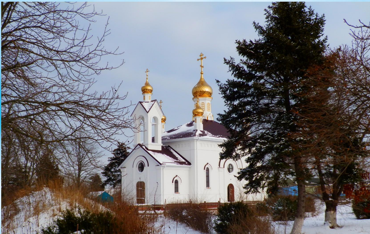
Храм «Всех Святых»