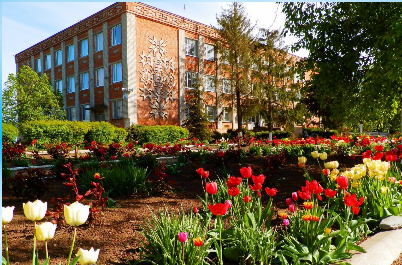
ЗДАНИЕ АДМИНИСТРАЦИИ и ЗАО «ПРИМОРСКОЕ»