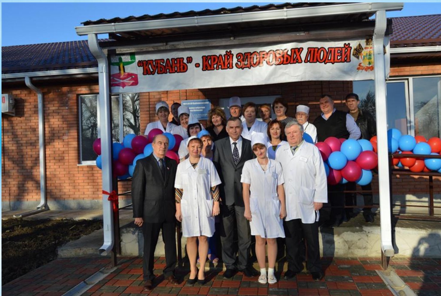
ЗДАНИЕ ВРАЧЕБНОЙ АМБУЛАТОРИИ, декабрь 2017 год