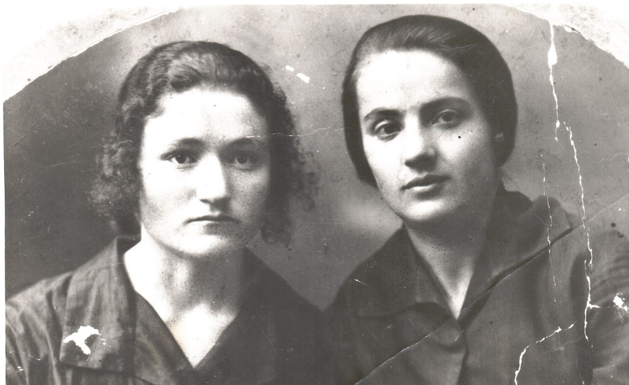
Вергуш с мамой

Сентябрь далёкого 1950 года. В одной из ленинских школ объявлен конкурс в ученический хор. Хрупкая десятилетняя девчушка, страстно любящая петь, очень хочет попасть в состав участников школьного хора. Её мама делает из куска сатина выкройку для платья, всё это наживляет нитками. Но дочь не может ждать, одевает недоделанную вещь, и босиком, семья жила бедно, как и вся остальная страна, пережившая страшную войну, бежит в родную школу.