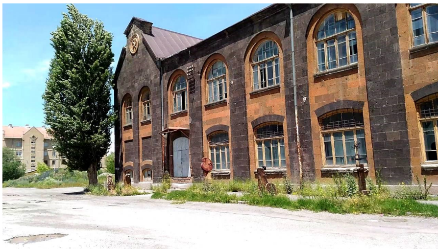
Текстильный комбинат в Ленинакане

После восьмого класса в шестнадцатилетнем возрасте пошла работать на текстильный комбинат, на котором трудилась контролёром ОТК восемь лет, продолжая выступать в клубном хоре.