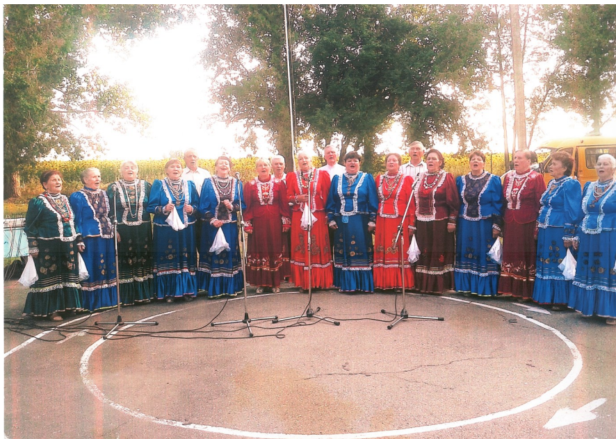
Вергуш с родной «Вечёркой»

Затем перешла, в ставший родным, фольклорный ансамбль «Вечёрка», где выступает и по сей день. Коллектив очень востребован слушателями, постоянно приглашается на различные концерты, торжества, празднование дней улиц станицы, на которых радуется своим многочисленным поклонникам русскими и казачьими песнями.