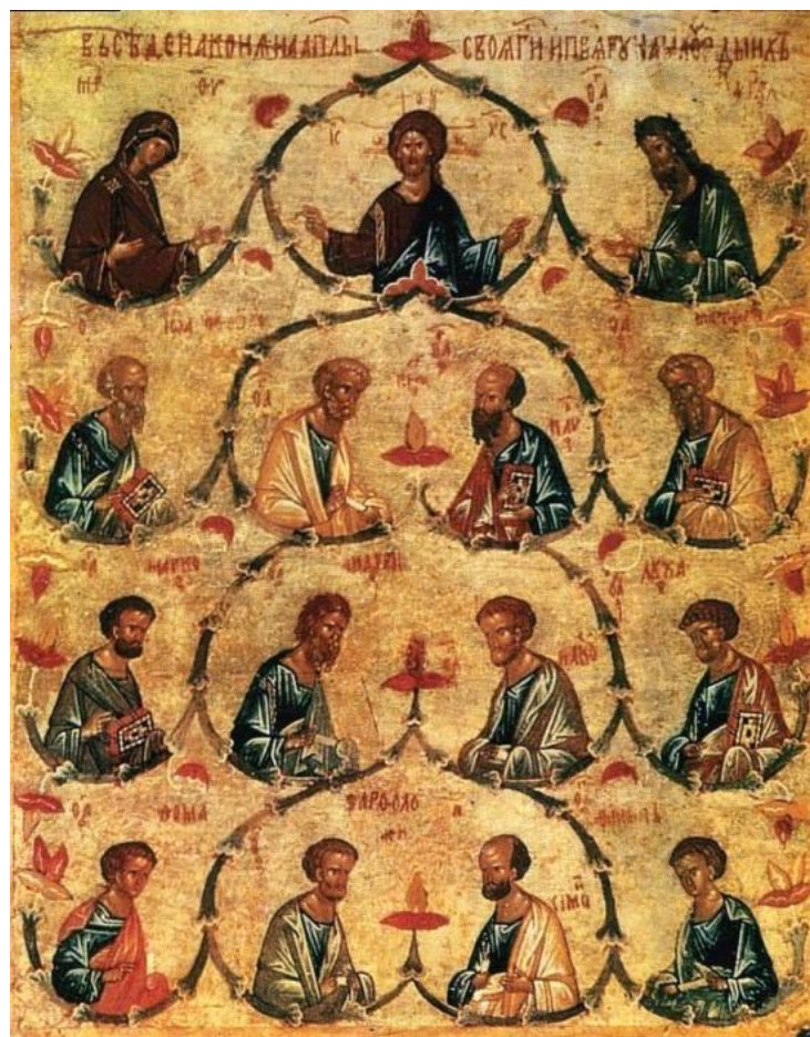
Собор апостолов. Кон. XV – нач. XVI в., ГТГ, Москва

Со дня сошествия Духа Утешителя праздник Пятидесятницы стал называться еще и праздником Пресвятой Троицы, потому что сошедший на учеников Дух Святой открыл людям более глубокое знание о Боге, а именно, что единый по существу Бог имеет три Лица. Бог Отец, Бог Сын и Бог Дух Святой – это единый Триипостасный Бог.