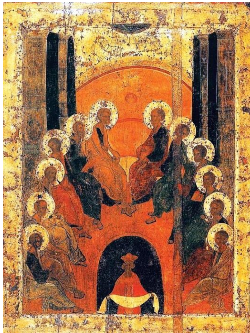
Сошествие Святого Духа на апостолов. Пятидесятница. Мастерская Андрея Рублева. 1425–1427 гг.