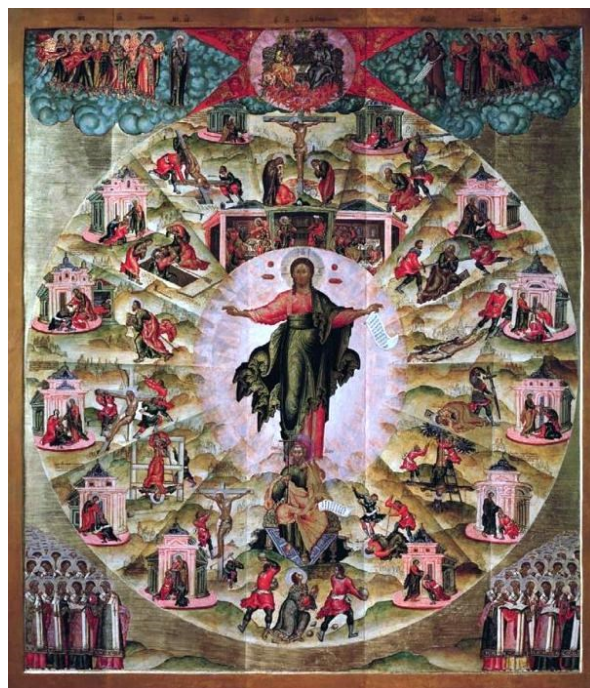
Апостольская проповедь. Федор Zubов. 1662 г.

На Руси отмечать Святую Пятидесятницу стали не в первые годы после Крещения Руси, а спустя почти 300 лет, в XIV веке, при преподобном Сергии Радонежском. С праздником Троицы связано много примет и народных обычаев. Хотя, в зависимости от дня Пасхи, время его празднования приходится на разное время и разрыв бывает довольно значительным, но неизменно этот день знаменует торжество наступающего лета, расцветающей природы, а символом этого расцвета на Руси испокон веков была молодая березка.