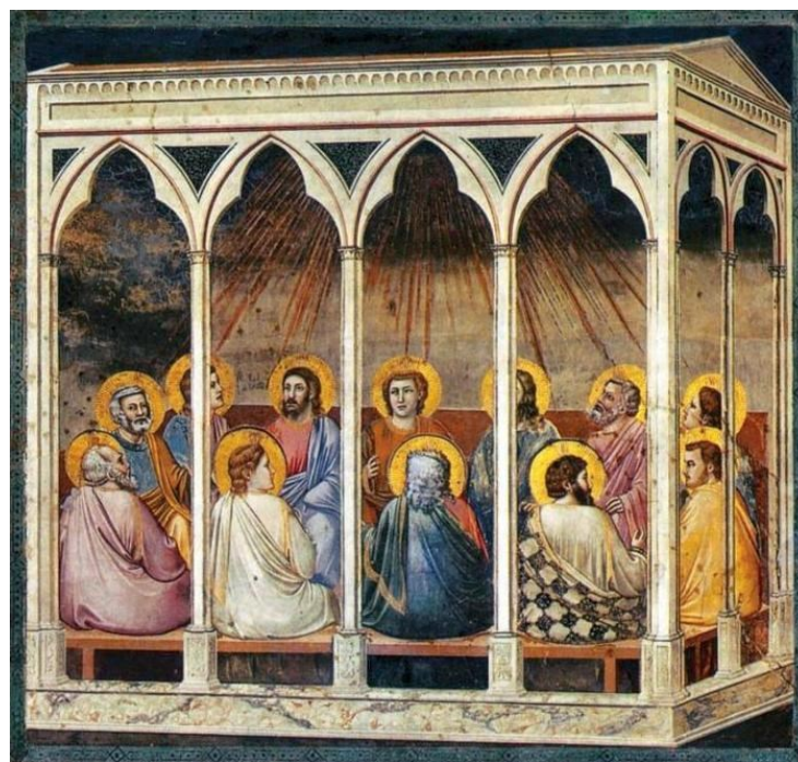
Сошествие Святого Духа на апостолов. Джотто. 1303–1313 гг. Капелла дель Арена, Падуя

Многие из уверовавших по слову апостола тут же всенародно покаялись в своих грехах и крестились, так что к вечеру этого дня Церковь Христова из 120 выросла до 3000 человек. Таким чудесным событием началось распространение Церкви Христовой, сначала в Иерусалиме, потом – в Иудее, а со временем и по всему миру. Этот великий день полного торжества Святого Духа над неверующими, стал одновременно днем рождения Церкви Христовой, которая, согласно обещанию Самого Спасителя пребудет на земле непобежденной всеми силами ада до Его славного Второго Пришествия.