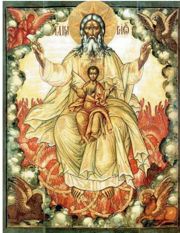
Отечество. 1680-е гг. Мастерская Оружейной палаты. Москва

Каждый из них почувствовал внезапно огромный прилив духовных сил и осознал себя новым, очищенным и полным горячей любви к Богу человеком. Так совершилось над ними то крещение Духом Святым и огнем, к которому их готовил Господь Иисус Христос. Считается, что Дух Святой сошел в виде огня в знак того, что имеет силу опалаять грехи и очищать, освящать и согревать душу.