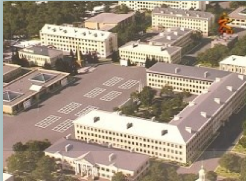
Коломенское военное училище