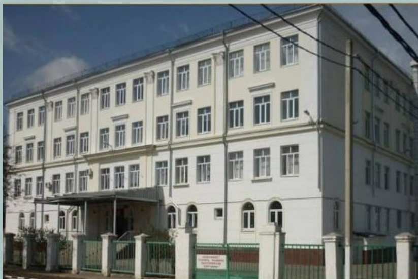
Школа №29 г. Краснодара

В 1970 году окончил среднюю школу №29 города Краснодара.