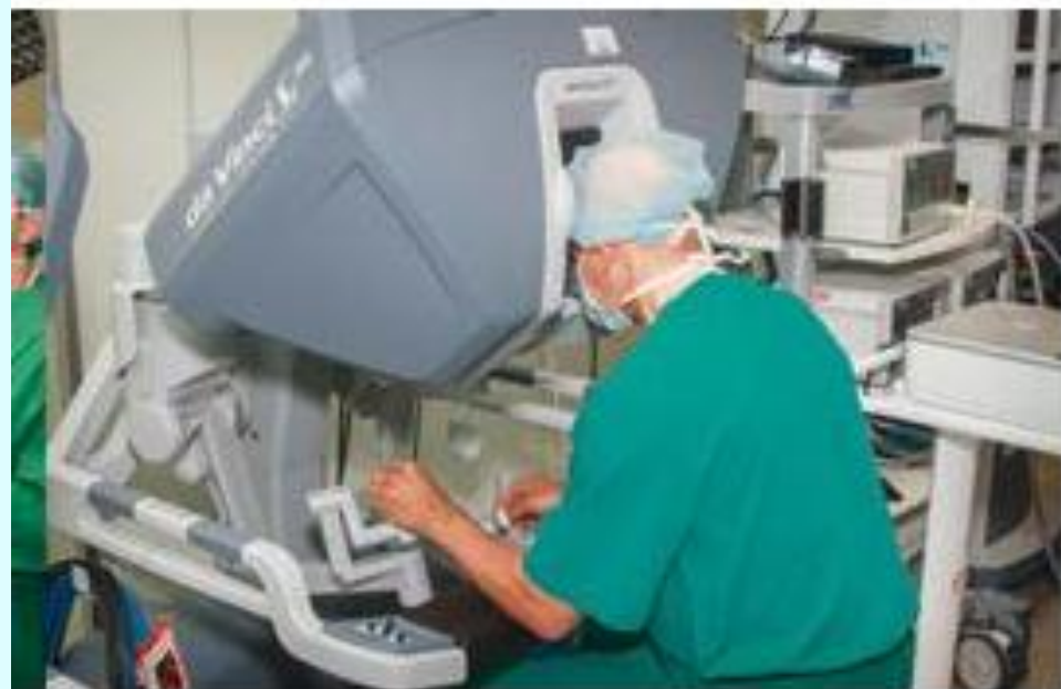
Врач-хирург управляет действиями робота дистанционно, манипулируя инструментами с помощью джойстика и 3D-изображения на экране