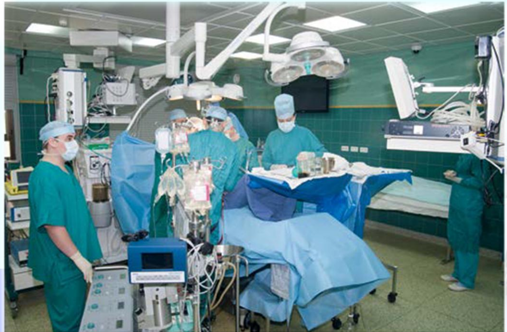
Идет кардиохирургическая операция

Богата земля кубанская урожаями, трудолюбивыми хлеборобами . Но не меньшую славу ей приносят и люди, чьей главной заботой является здоровье тех кто трудится на земле.