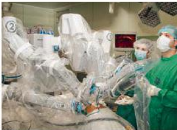
Урологическая операция с применением роботизированной системы Да Винчи

Средь множества профессий всех Есть та, чьей важности нет равной. Профессия врача одна Главенство держит полноправно.