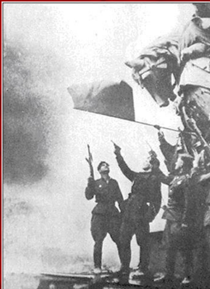
2 мая 1945 г. А. Берест, М. Егоров и Е. Кантария у Знамени Победы