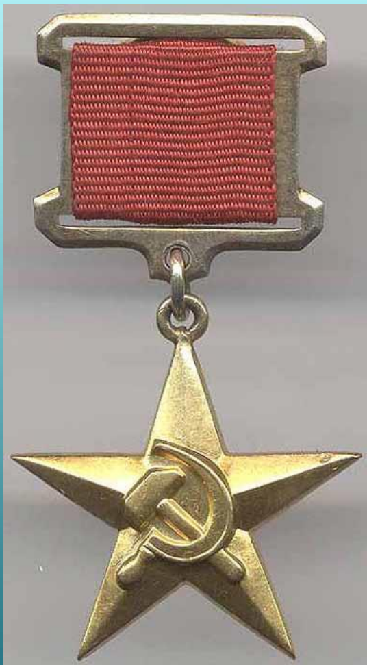
Медаль «Серп и молот»

Указом Президиума Верховного Совета СССР от 27 сентября 1974 года за большие заслуги в развитии советской литературы, активную общественную деятельность Катаеву Валентину Петровичу присвоено звание Героя Социалистического Труда с вручением ордена Ленина и золотой медали «Серп и молот».