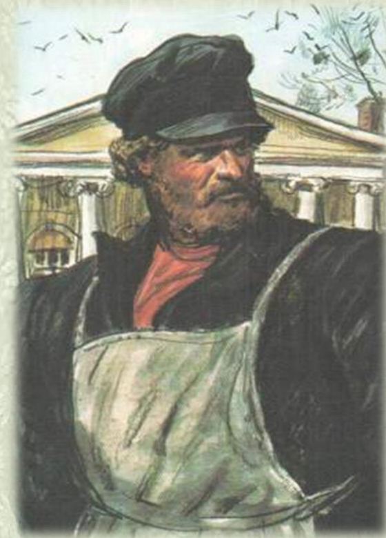
Иван Сергеевич Тургенев «Муму»

Мужчина двенадцати вершков роста, сложенный богатырем и глухонемой от рождения. Барыня взяла его из деревни, где он жил один, в небольшой избушке, отдельно от братьев, и считался едва ли не самым исправным тягловым мужиком.