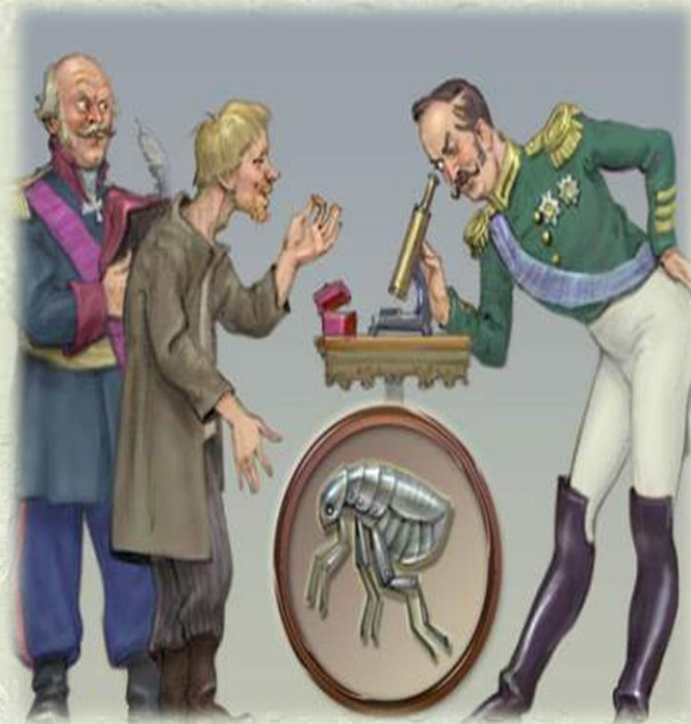
Николай Семёнович Лесков «Левша»

Идёт в чём был: в опорочках, одна штанина в сапоге, другая мотаётся, а озямчик старенький, крючки не застёгиваются, порастеряны, и шиворот разорван; но ничего, не конфузится.