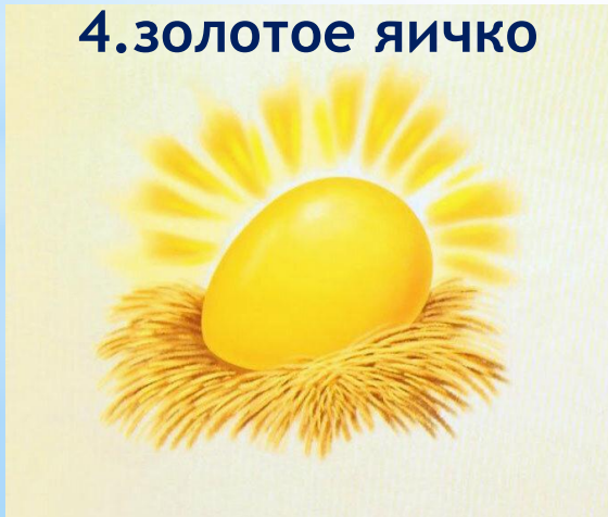
4. золотое яичко