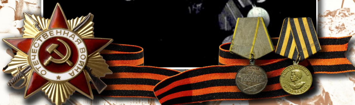
Присяжнюк Евдокия Тимофеевна