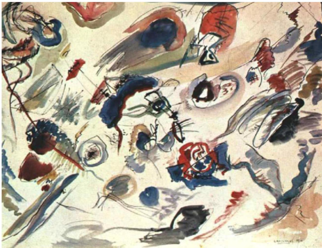
«Первая абстрактная акварель», 1910 год

Эта работа имеет историческую ценность, как первая полностью абстрактная акварель Кандинского.