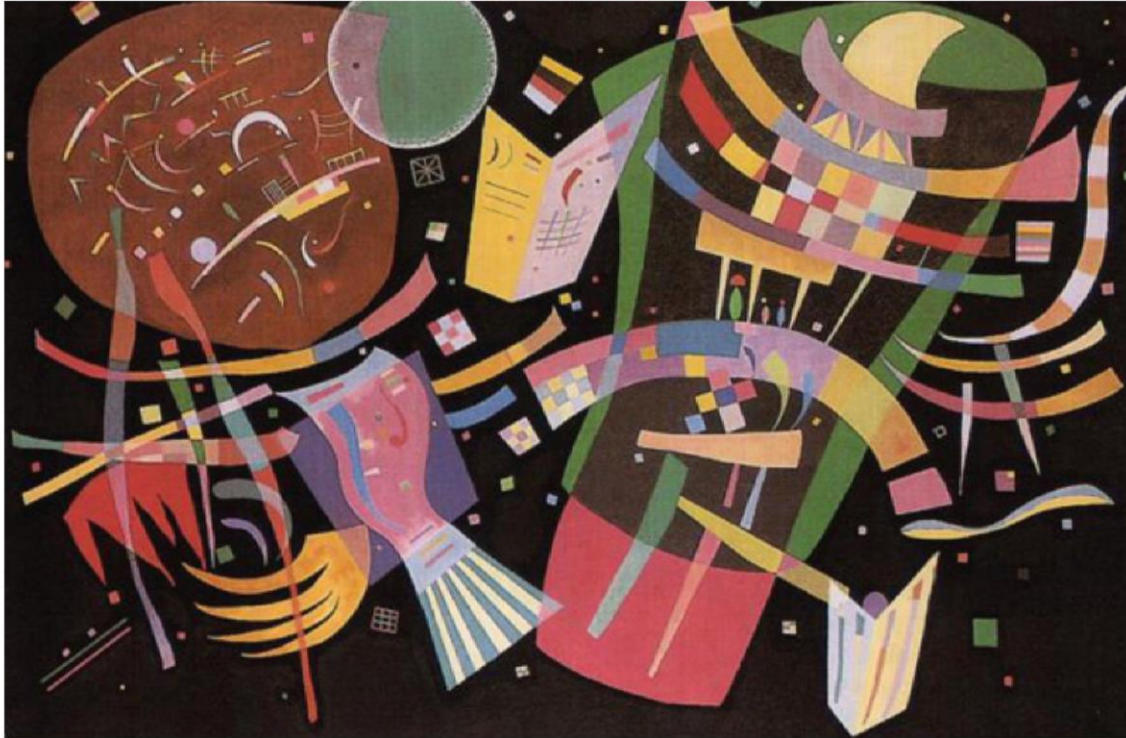
«Композиция X», 1939 год

Эта картина написана под влиянием музыки. Визуальные элементы пропорциональны музыкальным составляющим идеальной симфонии. Кандинский полагал, что это и есть секрет истинной живописи.