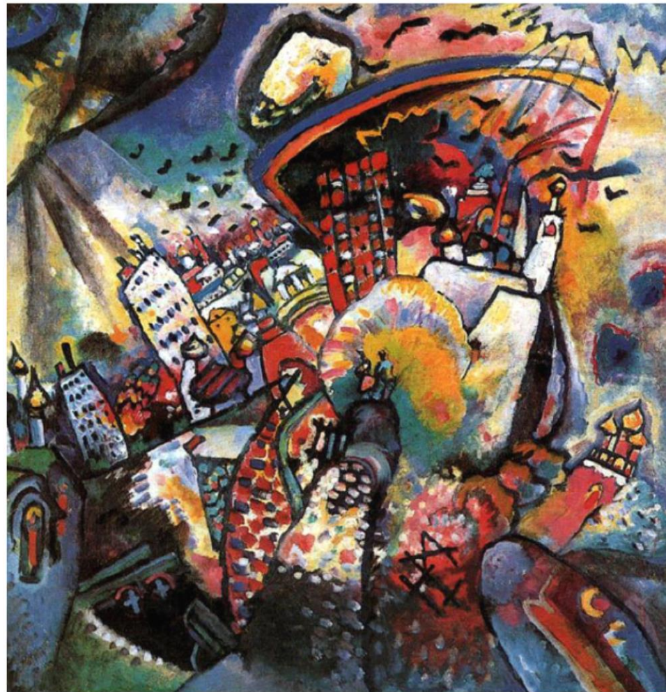
«Москва», 1916 год

Кандинский говорил, что Москва – это сложный и подвижный город. Он называл её путаницей, где переплетаются события, судьбы и люди. Но при этом для него Москва – это самый красивый город на планете Земля.