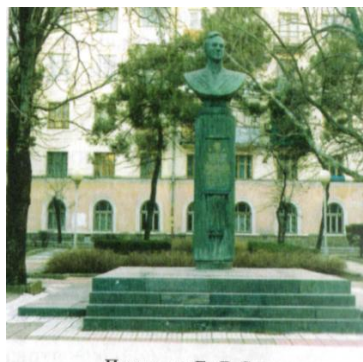
Памятник Е. Я. Савицкому