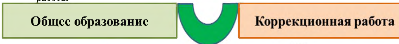
Рис. 1 Механизм параллельной интеграции общего образования и коррекционной работы

1.2.3. Принцип системности заключается в рассмотрении объекта как системы, куда включены ведущие компоненты образовательного процесса: