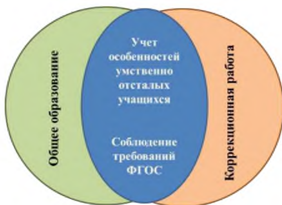
Рис. 4 Целостность комплекса общего и коррекционного образования

Целостность комплекса общего и коррекционного образования заключается в общих подходах к организации образовательного процесса, которые выражаются, во-первых, в учете всех категорий особенностей учащихся, а во-вторых, - в соблюдении организационно-технологических и содержательных требований федерального государственного стандарта основного общего образования (ФГОС ООО)