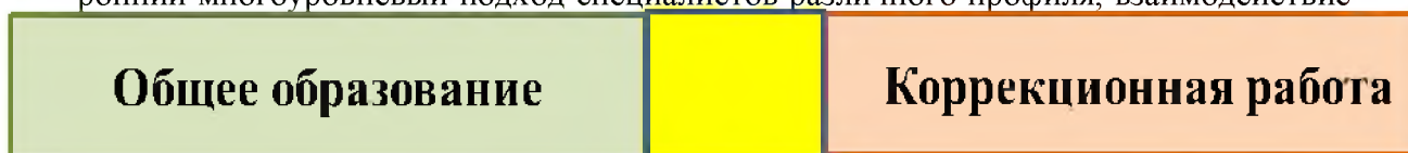
Рис. 2 Включенная интеграция общего образования и коррекционной работы применение системного подхода к анализу особенностей развития и коррекции нарушений у детей с ограниченными возможностями здоровья обеспечивает всесторонний многоуровневый подход специалистов различного профиля, взаимодействие

1.2.4. Принцип систематичности в обучении заключается в том, что все должно быть