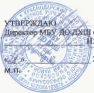
ГРАФИК ОБРАЗОВАТЕЛЬНОГО ПРОЦЕССА НА 2020-2021 УЧЕБНЫЙ ГОД