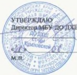
ГРАФИК ОБРАЗОВАТЕЛЬНОГО ПРОЦЕССА НА 2020-2021 УЧЕБНЫЙ ГОД

срок освоения 2 года Дополнительная общеразвивающая программа в области раннего эстетического развития детей