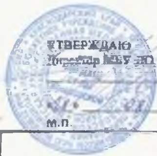
ГРАФИК ОБРАЗОВАТЕЛЬНОГО ПРОЦЕССА НА 2020-2021 УЧЕБНЫЙ ГОД