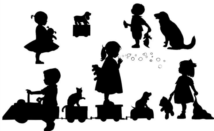
Силуэт черный на белом фоне