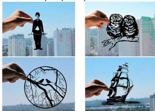
Силуэты можно не только рисовать, но и вырезать! Вот с какой точностью художник должен определять характерные черты объекта.