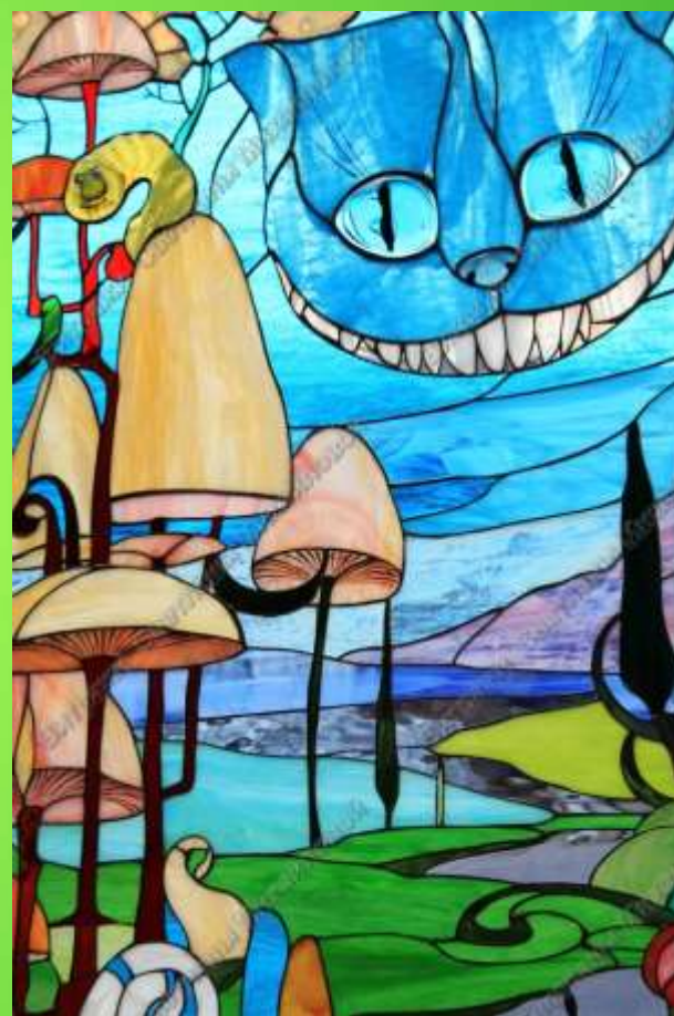
«Алиса в стране чудес»