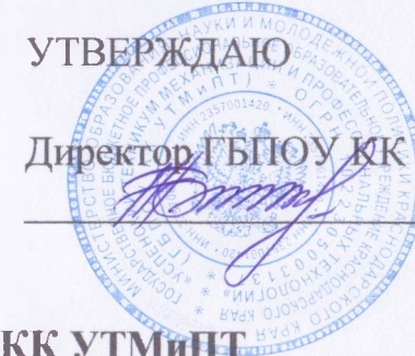
График работы кружков дополнительного образования ГБПОУ КК УТМиПТ на 2023-2024 учебный год