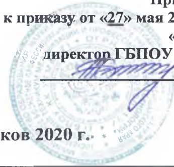
ГРАФИК проведения государственной итоговой аттестации выпускников 2020 г. *