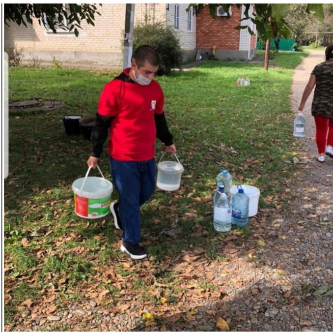
Участвовали в акции «Поддай руку помощи»