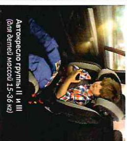
Автокресло группы II и III (для детей массой 15-36 кг)