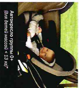
Автокресло группы 0+ (для детей массой < 13 кг)*