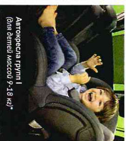
Автокресла групп I (для детей массой 9-18 кг)*