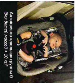
Автокресло «лягушка» группы 0 (для детей массой < 10 кг)*

При покупке детского удерживающего устройства обязательно следует уточнить у продавца наличие сертификата на товар!