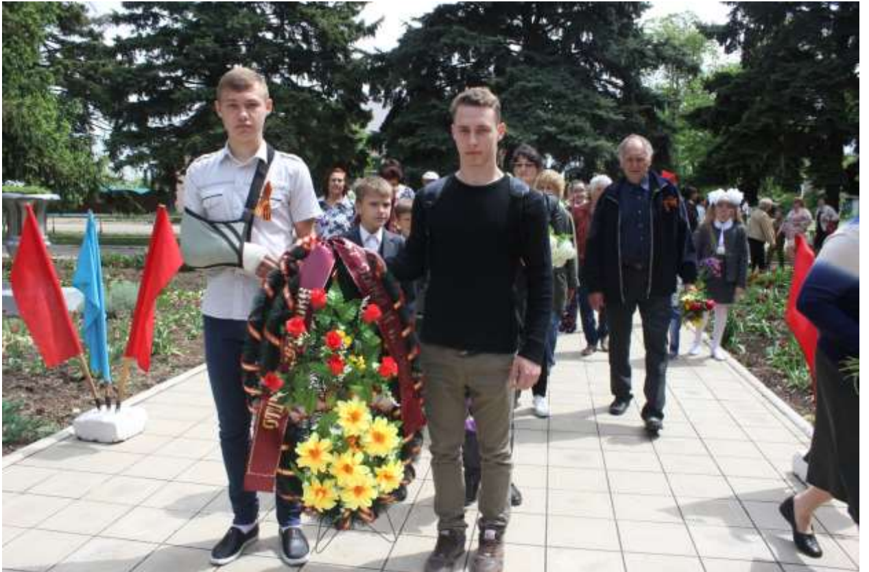
Почетный караул у памятника погибшим землякам в годы Великой Отечественной войны