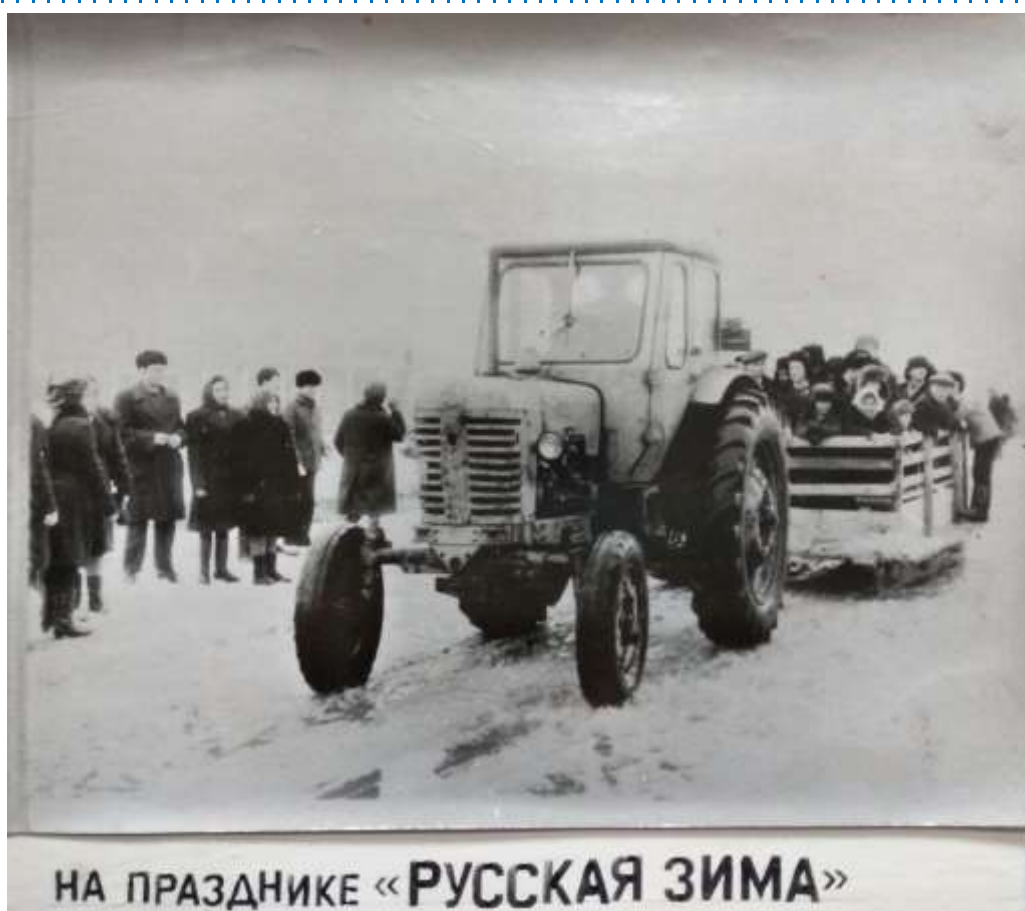
НА ПРАЗДНИКЕ «РУССКАЯ ЗИМА»