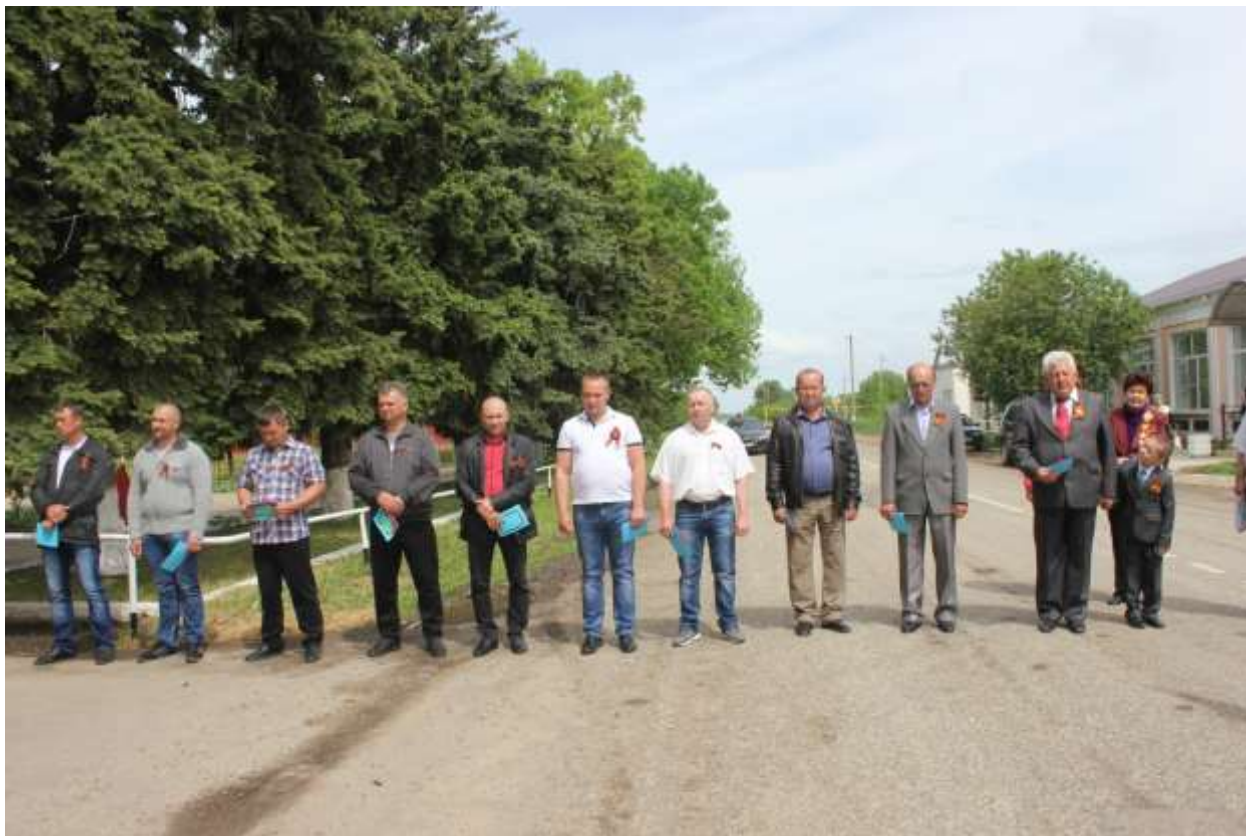
Возложение венков и цветов организациями и жителями