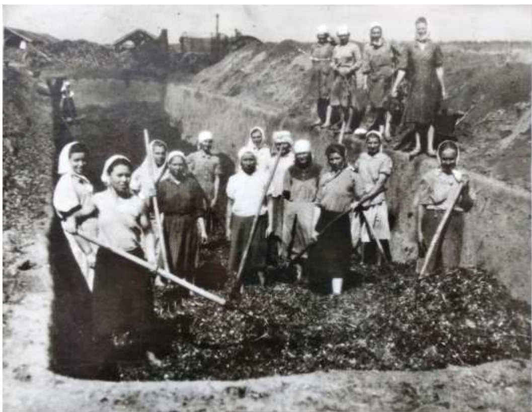
ЗАГОТОВКА СИЛОСА В С-ЗЕ «ЗВЕЗДА» 1949 г.