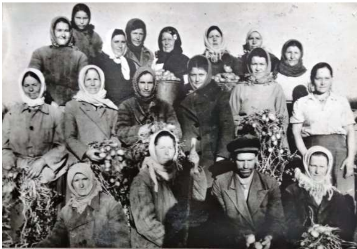
ЗВЕНО НА УБОРКЕ КАРТОФЕЛЯ