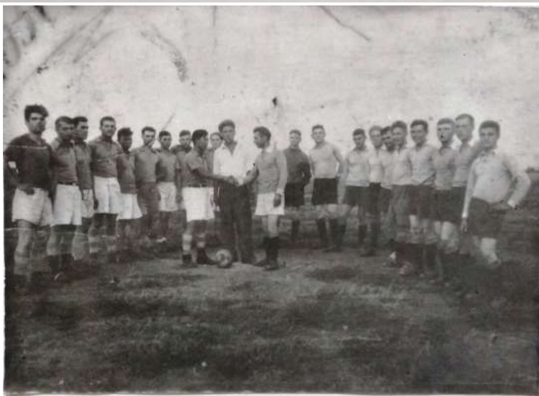
ФУТБОЛЬНЫЕ КОМАНДЫ СОВХОЗОВ «ЗВЕЗДА»