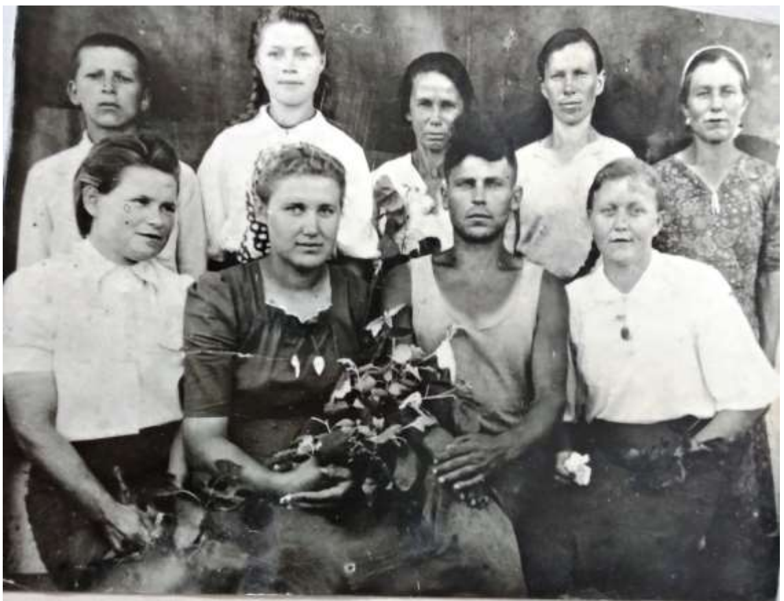
РАБОТНИКИ СТФ - 3 С-ЗА « ЗВЕЗДА »