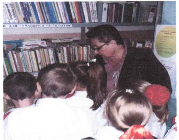
«Книга в дар библиотеке»