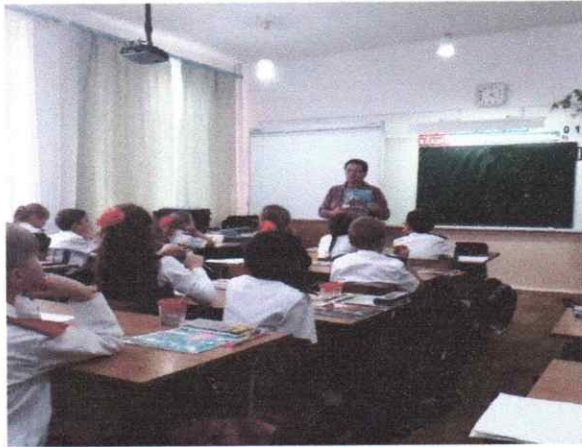
Библиотечный урок «Сохрани учебник»