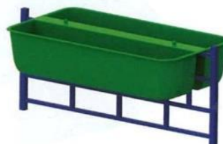
0686 Двойной подвесной вазон (без ограждения)