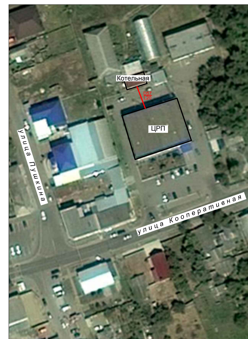
Фрагмент территорий ст. Крыловская - схема теплоснабжения котельной ЦРП