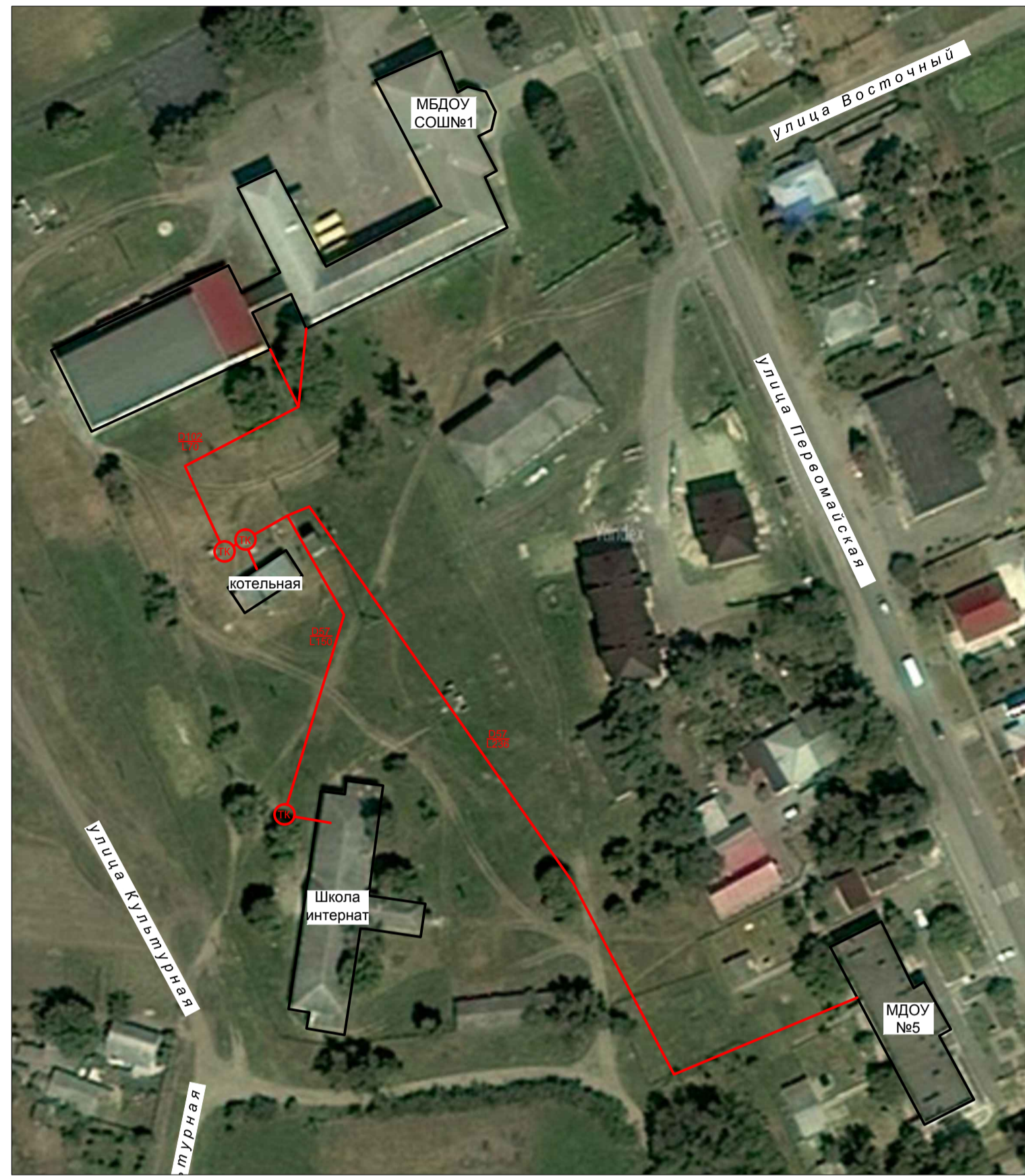
Фрагмент территорий ст. Крыловская - схема теплоснабжения котельной МДОУ "Ивушка"