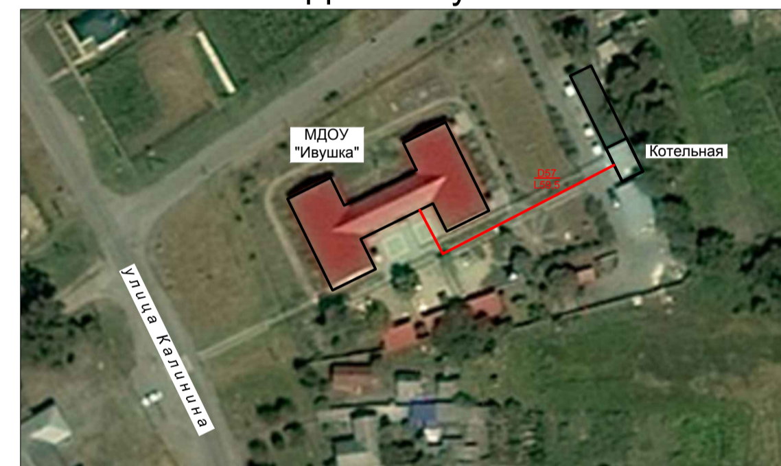
Фрагмент территорий ст. Крыловская - схема теплоснабжения котельной МДОУ "Ивушка"