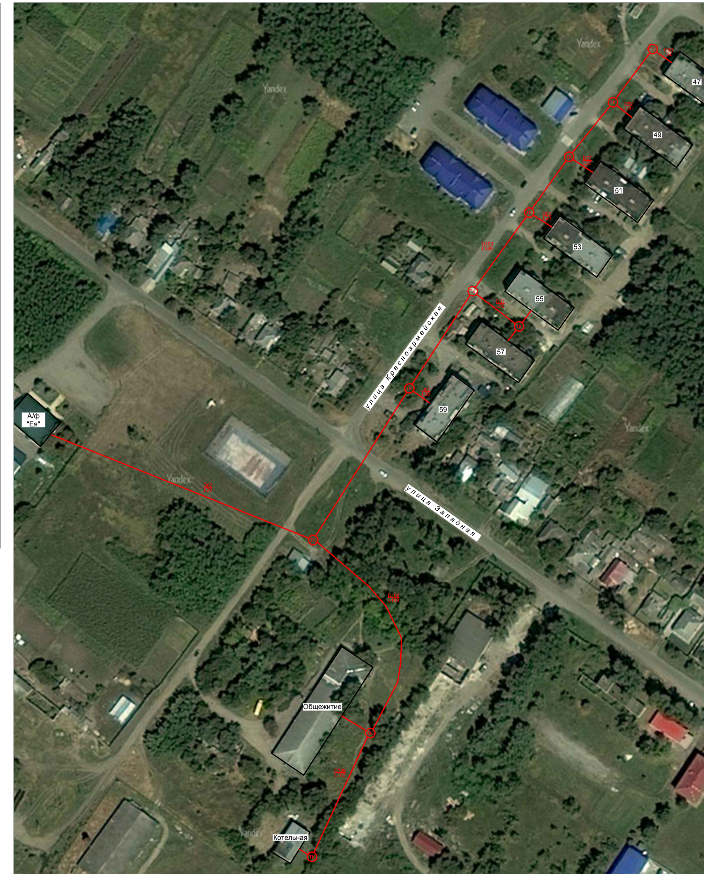
Фрагмент территорий ст. Крыловская - схема теплоснабжения котельной МПМК