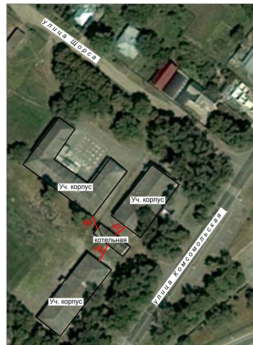
Фрагмент территорий ст. Крыловская - схема теплоснабжения котельной СОШ №3