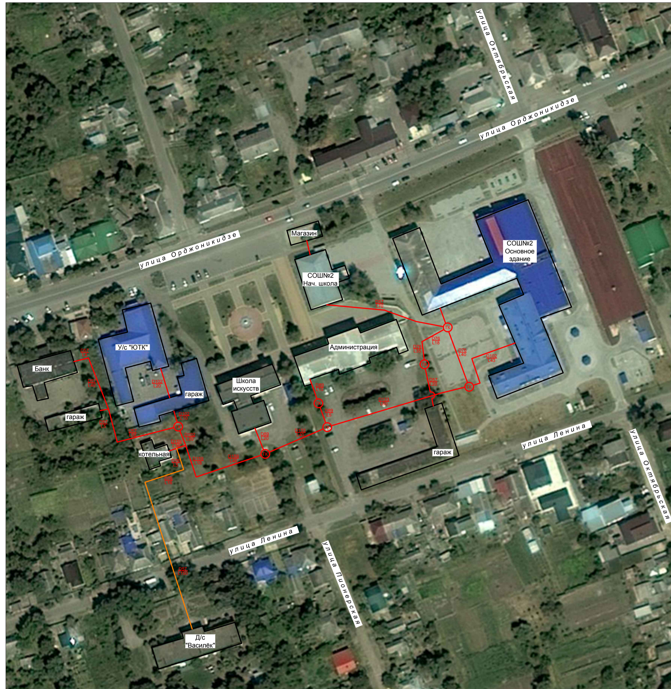
Фрагмент территорий ст. Крыловская - схема теплоснабжения котельной Школы искусств