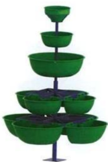
0684 Набор вазонов «Ёлочка»