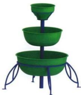
0699 Набор вазонов «Пирамида»