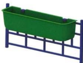
0685 Подвесной вазон (без ограждения)