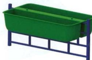
0686 Двойной подвесной вазон (без ограждения)