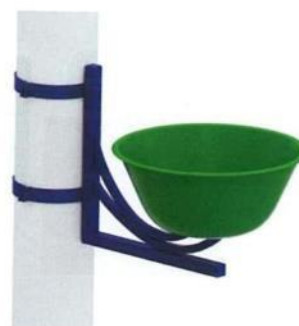
0691 Вазон подвесной