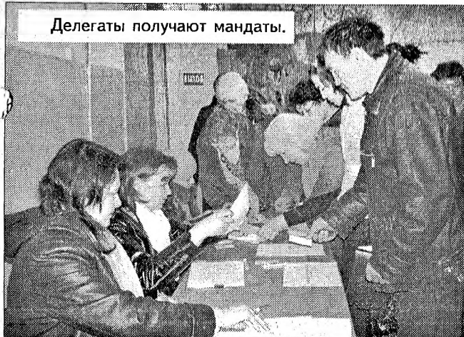
Делегаты получают мандаты.