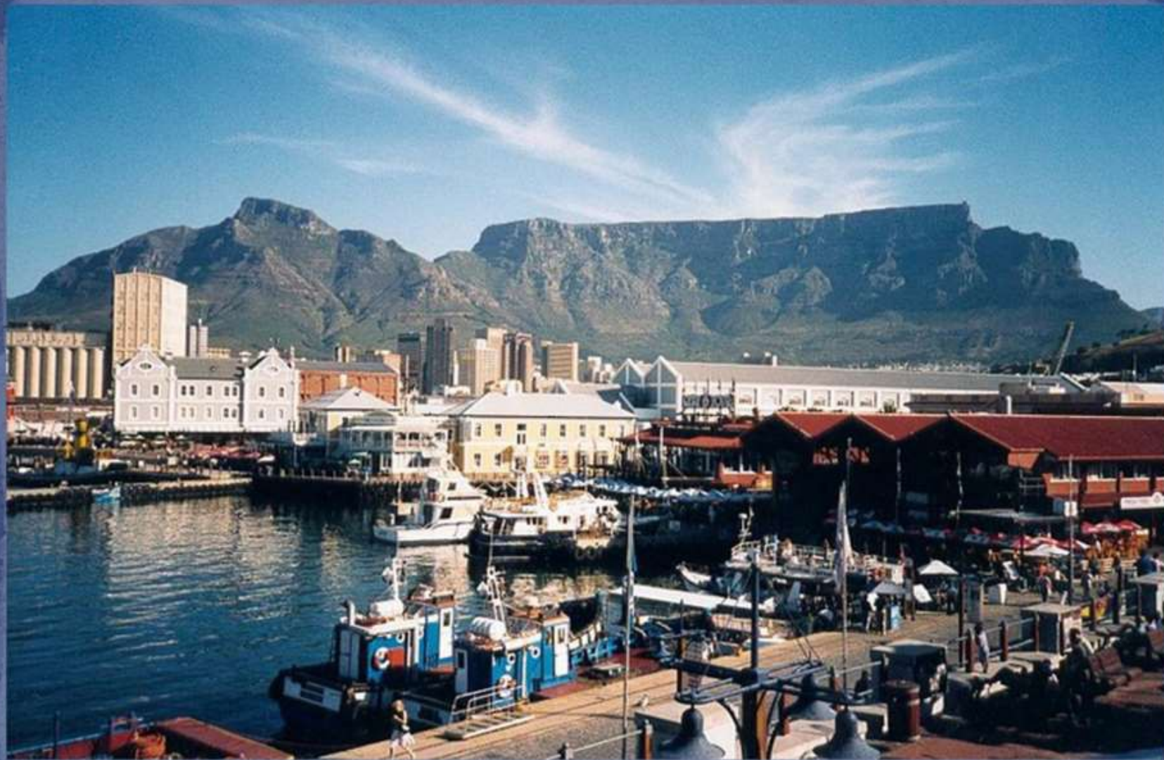
Вид из Кейптауна