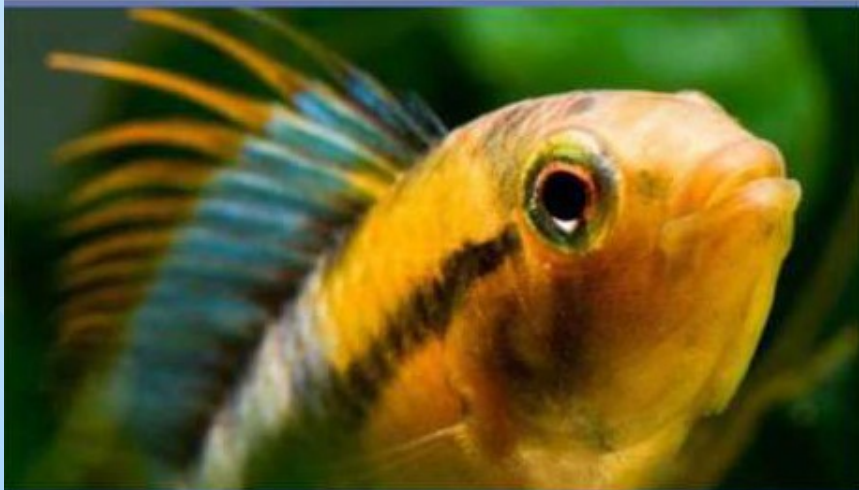
Apistogramma baenschi (открыта в 2004г)