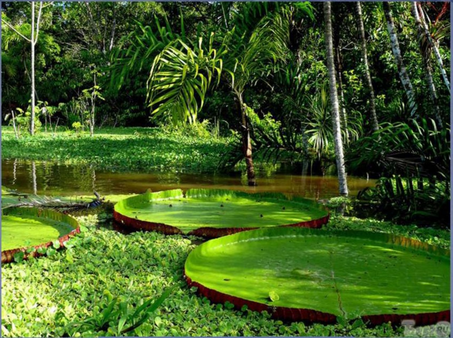
Виктория регия амазонская