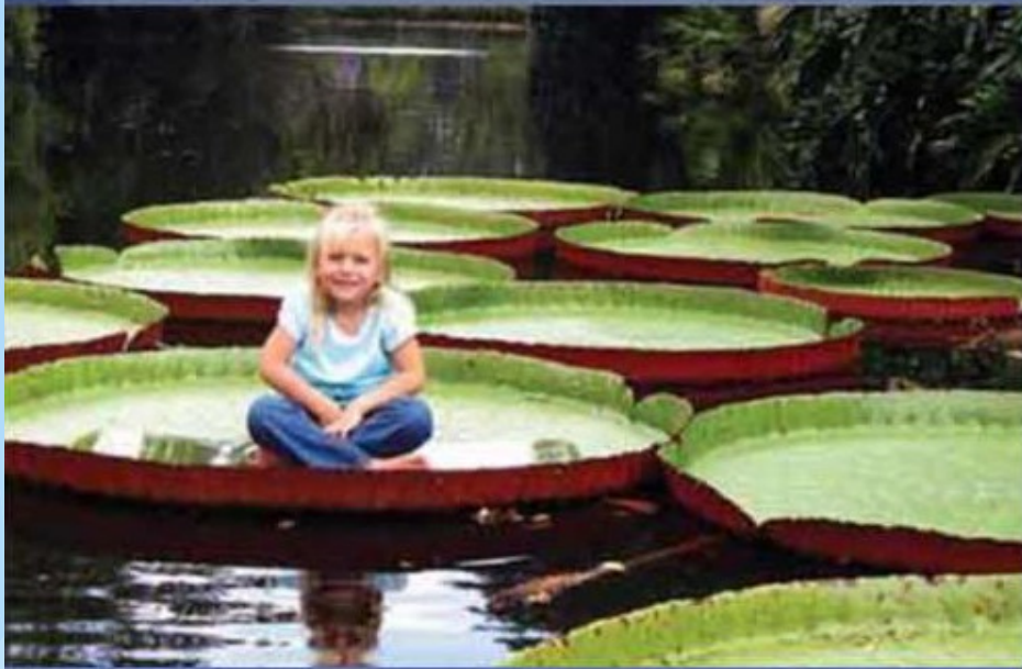
Самая большая кувшинка в мире