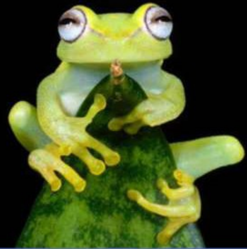
Древесная лягушка, откладывает яйца на листьях