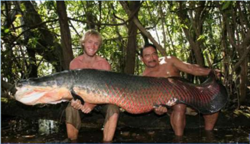
Арапайма гигантская или пираруку - самая крупная пресноводная рыба в мире (до 4м, ок. 200кг)