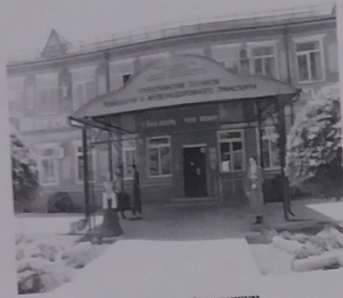
Кропоткинский техникум технологий и железнодорожного транспорта село Ванновское

В настоящее время в ГБПОУ «КТ и ЖТ» обучают профессии мастеров общестроительных и отделочных строительных работ, сварщика, повара, кондитера, машиниста локомотива, слесарей по обслуживанию и ремонту подвижного состава железных дорог и по ремонту строительных машин, автомеханика, тракториста-машиниста сельхозпроизводства, электронщика электромеханических сетей и электроборудования. Также на базе 9 классов можно получить образование по специальности «Технология продукции общественного питания» и «Техническая эксплуатация подвижного состава железных дорог», а на базе 11 классов – «Технология продукции общественного питания». А параллельно этому здесь приобретают и второе профессиональное образование на платной основе.