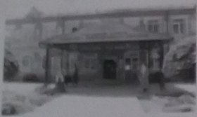
Кропоткинский техникум технологий и железнодорожного транспорта село Ванновское

В настоящее время в ГБПОУ «КТ и ЖТ» обучают профессии мастеров общестроительных и отделочных строительных работ, сварщика, повара, кондитера, машиниста локомотива, слесарей по обслуживанию и ремонту подвижного состава железных дорог и по ремонту строительных машин, автомеханика, тракториста-машиниста сельхозпроизводства, электронщика электромеханических сетей и электроборудования.