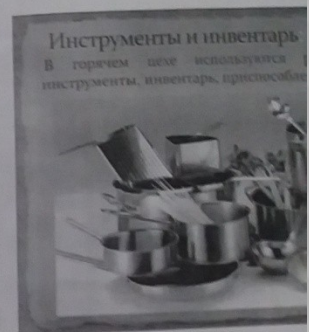
Инструменты и инвентарь В горячем цехе используются инструменты, инвентарь, приспособления

Повар – это специалист в области приготовления пищи, который организует работу в кухне, следит за температурой в холодильнике, за чистотой посуды, за качеством продуктов, за работой персонала кухни, за соблюдением санитарных норм, за работой оборудования кухни, за работой посудомоечной машины, за работой вытяжки, за работой вентиляции, за работой кондиционера, за работой отопления, за работой водоснабжения, за работой канализации, за работой электроснабжения, за работой газоснабжения, за работой вентиляции, за работой кондиционера, за работой отопления, за работой водоснабжения, за работой канализации, за работой электроснабжения, за работой газоснабжения.