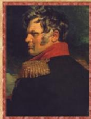
Генерал от инфантерии ЕРМОЛОВ Алексей Петрович (1777-1861)