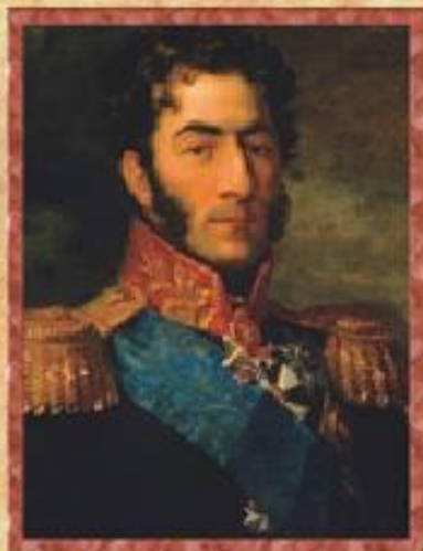
Генерал от инфантерии БАГРАТИОН Петр Иванович (1765-1812)