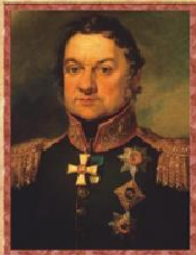
Генерал от инфантерии ДОХТУРОВ Дмитрий Сергеевич (1759-1816)