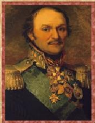
Генерал от кавалерии ПЛАТОВ Матвей Иванович (1753-1818)