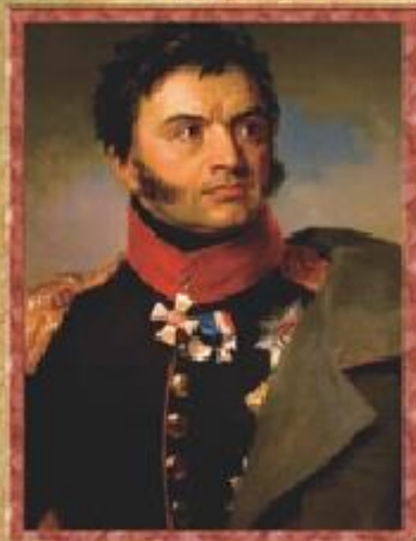
Генерал от кавалерии РАЕВСКИЙ Николай Николаевич (1773-1829)