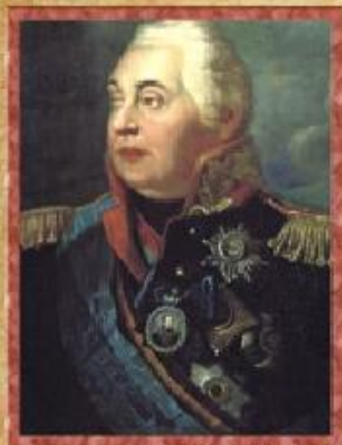
Генерал-фельдмаршал КУТУЗОВ Михаил Илларионович (1745-1813)