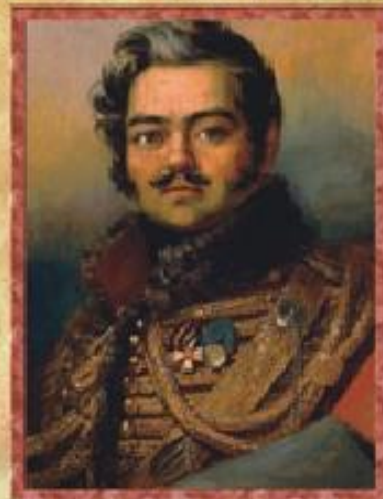
Генерал-лейтенант ДАВЫДОВ Денис Васильевич (1774-1839)