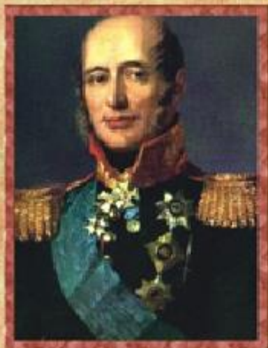
Генерал-фельдмаршал БАРКЛАЙ де ТОЛЛИ Михаил Богданович (1761-1818)