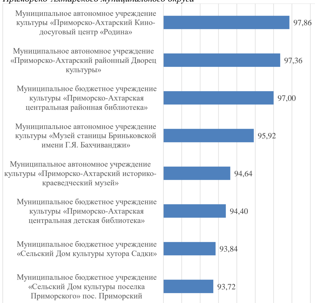
Гистограмма 1. Рейтинг по результатам сбора, обобщения и анализа информации о качестве условий оказания услуг организациями культуры Приморско-Ахтарского муниципального округа