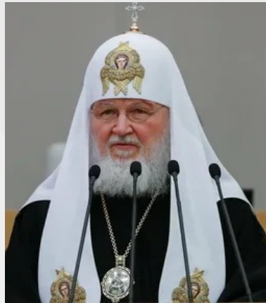
Патриарх Кирилл - епископ Русской православной церкви. Патриарх Московский и всея Руси с 1 февраля 2009 года.