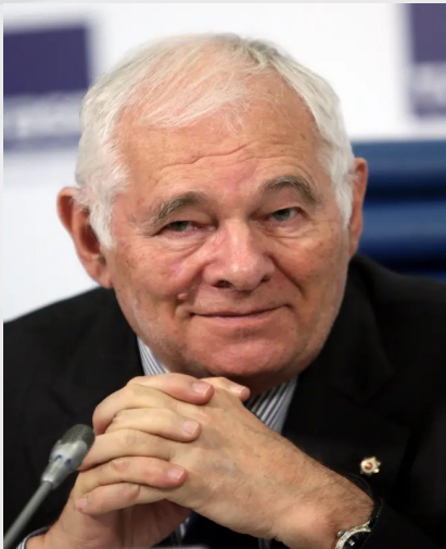
Рошаль Леонид Михайлович – президент государственного бюджетного учреждения здравоохранения города Москвы «Научно-исследовательский институт неотложной детской хирургии и травматологии» 2019 год