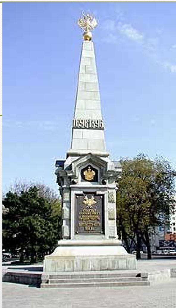
Обелиск 200-летию Кубанского казачьего войска. Автор проекта - архитектор В.А. Филиппов. (Обелиск был открыт в 1897 г., демонтирован в 1920 г. Восстановлен в 1999 г.).