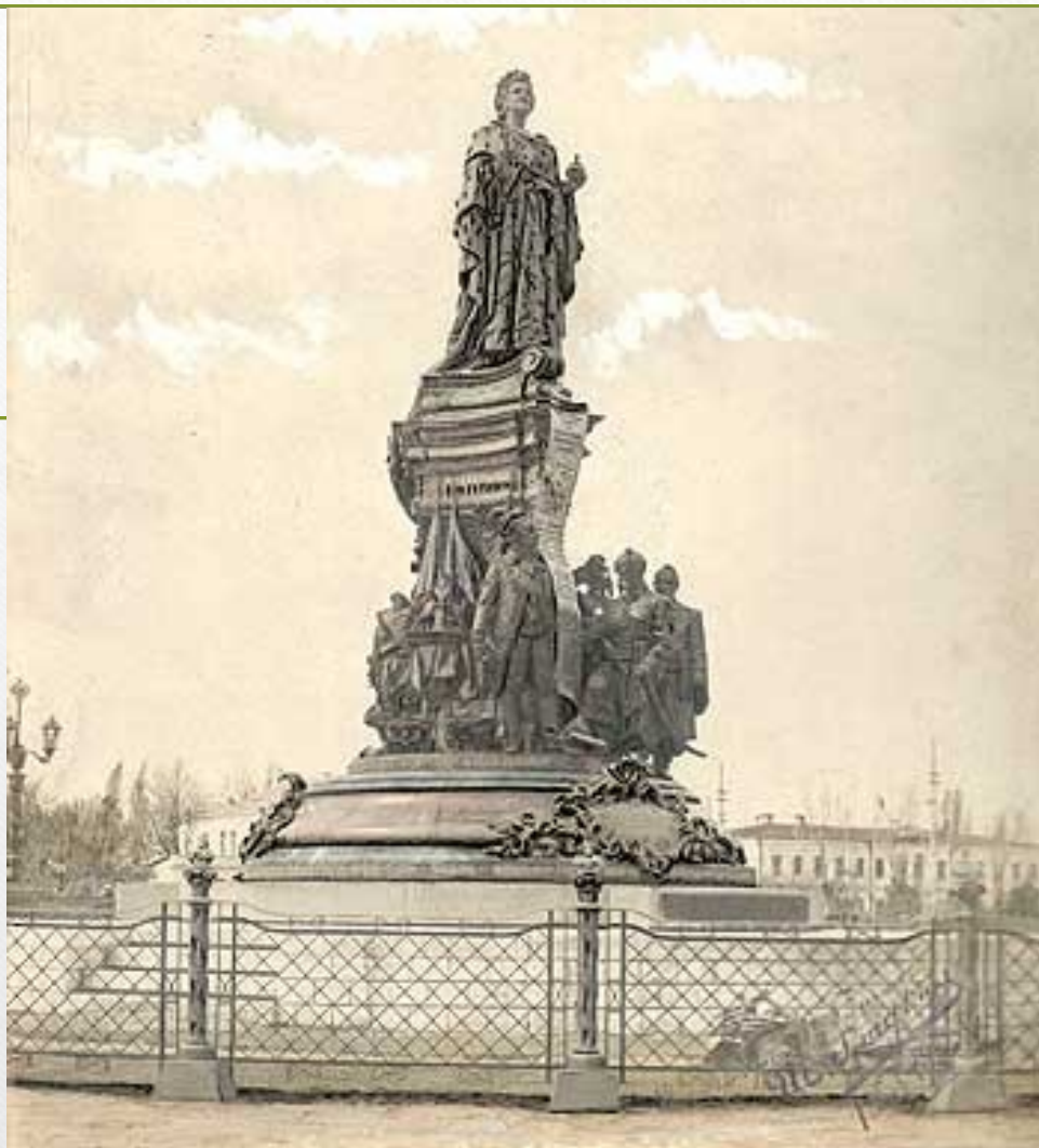
Памятник Екатерине II. Скульпторы М.О. Микешин и Б.И. Эдуардс. Открыт в 1907 г. Демонтирован осенью 1920 г. Восстановлен в 2006 г.