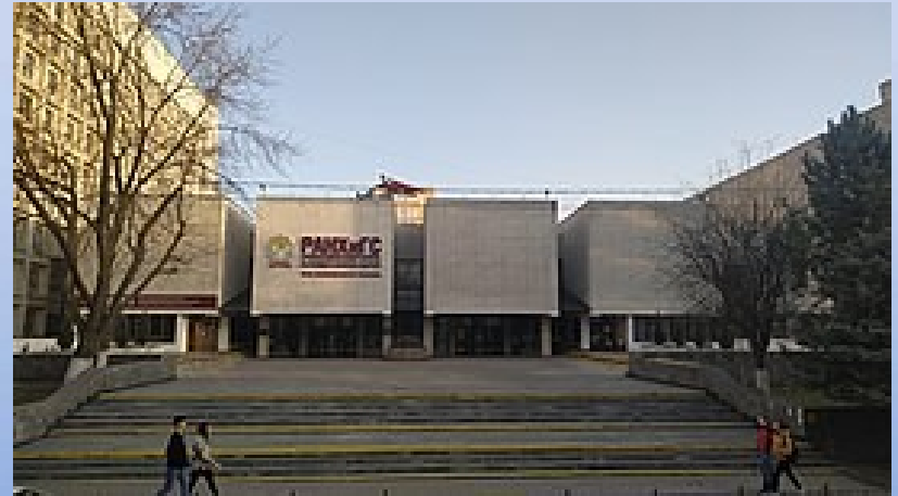
Ростовская высшая партийную школа