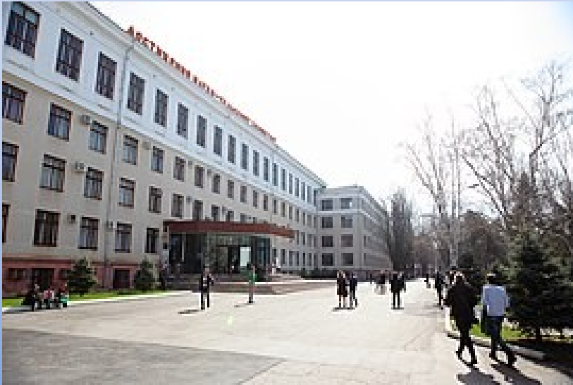
Кубанский сельскохозяйственный институт

Он окончил Кубанский сельскохозяйственный институт в Краснодаре и Ростовскую высшую школу, являлся кандидатом сельскохозяйственных наук.