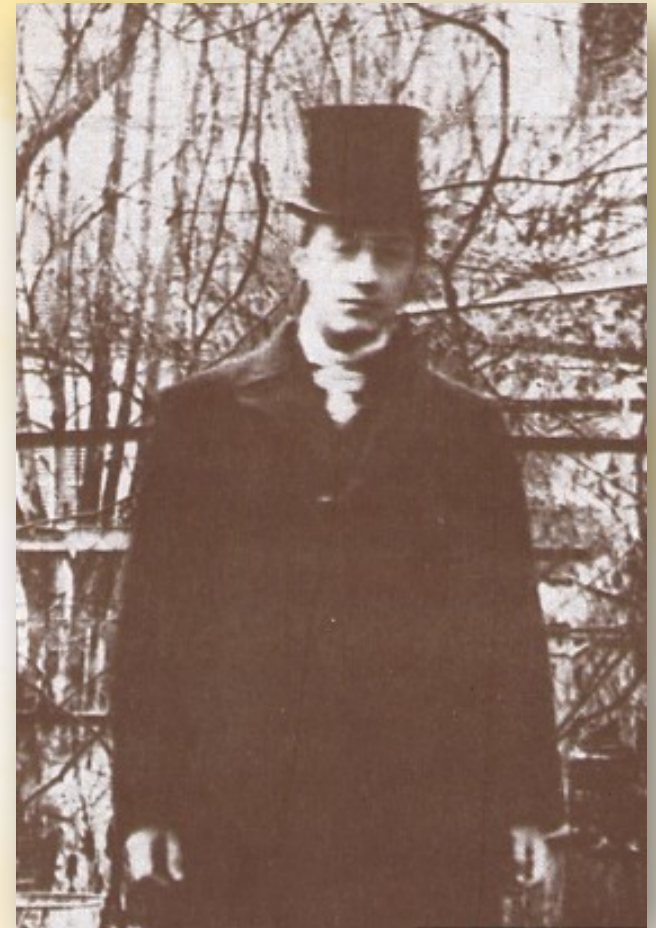
Н. Гумилёв в Париже

Николая Гумилева всегда тянуло в заморские страны, ему хотелось увидеть все, испытать новые чувства, а затем оформить свои впечатления в стихи. Он уехал в Париж , «душа требовала расстояний и впечатлений». Париж стал для Гумилева вторым домом. Сюда он приезжал очень часто, но стихи раздаривал другим городам, которые затмевали образ привычного Парижа.