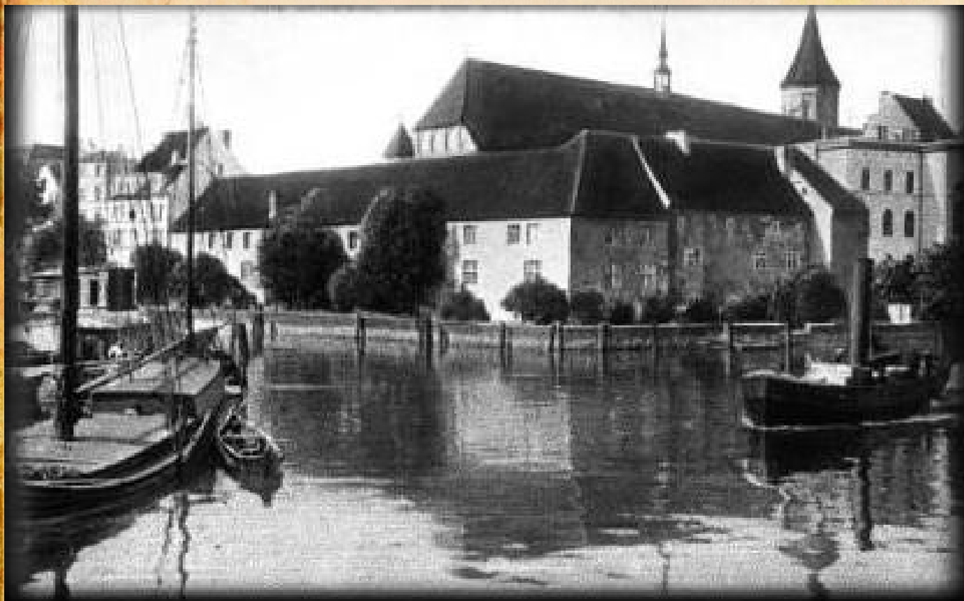
Университет Альбертина до 1944 года

По воле родителей этот юноша должен был, как и все его предки, стать чиновником. Юный Гофман покорился, окончил университет и много лет служил в разных судебных ведомствах.