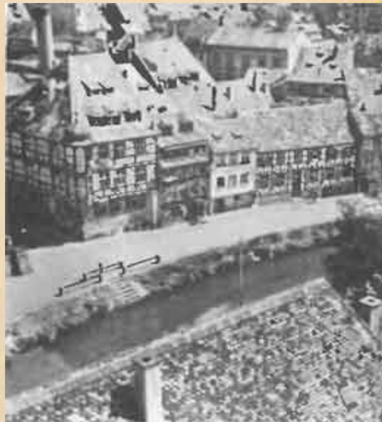
Бамберг. Вид на город у канала.