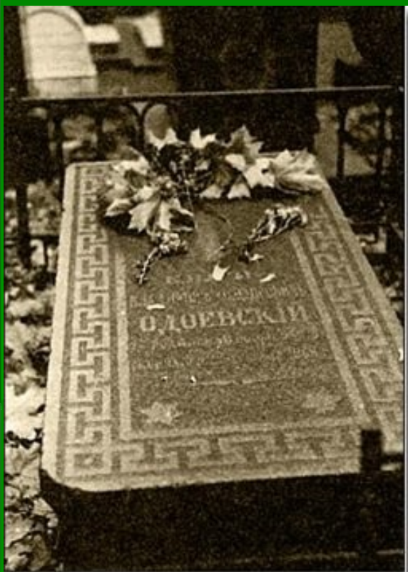
Могилы В.Ф. Одоевского в Донском монастыре

Умер Одоевский в Москве 27 февраля 1869, не оставив после себя ни детей, ни какого-либо состояния. Похоронен на Донском кладбище в Москве.