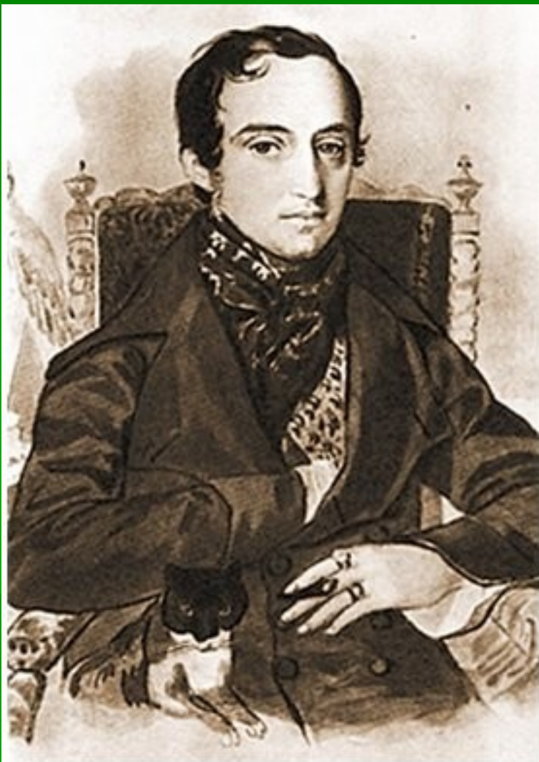
Кн. Владимир Федорович Одоевский