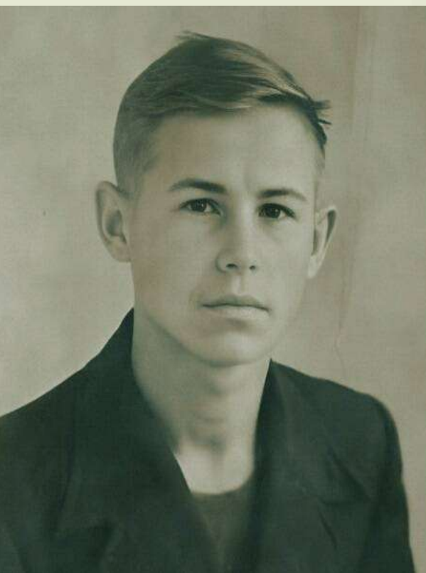
Н.М.Рубцов во время Учебы в техникуме

Детские мечты быстро разбились о суровую реальность: в мореходное училище его не приняли по причине малого возраста. Разочарованный подросток вернулся в детдом и подал документы в Тотемский лесной техникум. Через два года, не окончив техникум, Рубцов сорвался в Архангельск, поступил угольщиком на рыболовный сейнер, на котором работал 10 месяцев. Срочную службу проходил в Северном флоте — четыре года. Ходил по Баренцеву морю на эсминце «Острый». Там публиковал стихи во флотской прессе. После демобилизации долго не мог расстаться с тельняшкой, носил ее с гордостью. Таких называли «перекати-поле». Он переехал в Ленинград, устроился слесарем на знаменитый Кировский — бывший Путиловский — завод. Там стал посещать литературное объединение — и молодые стихотворцы ахнули: этот моряк писал, как им и не снилось.