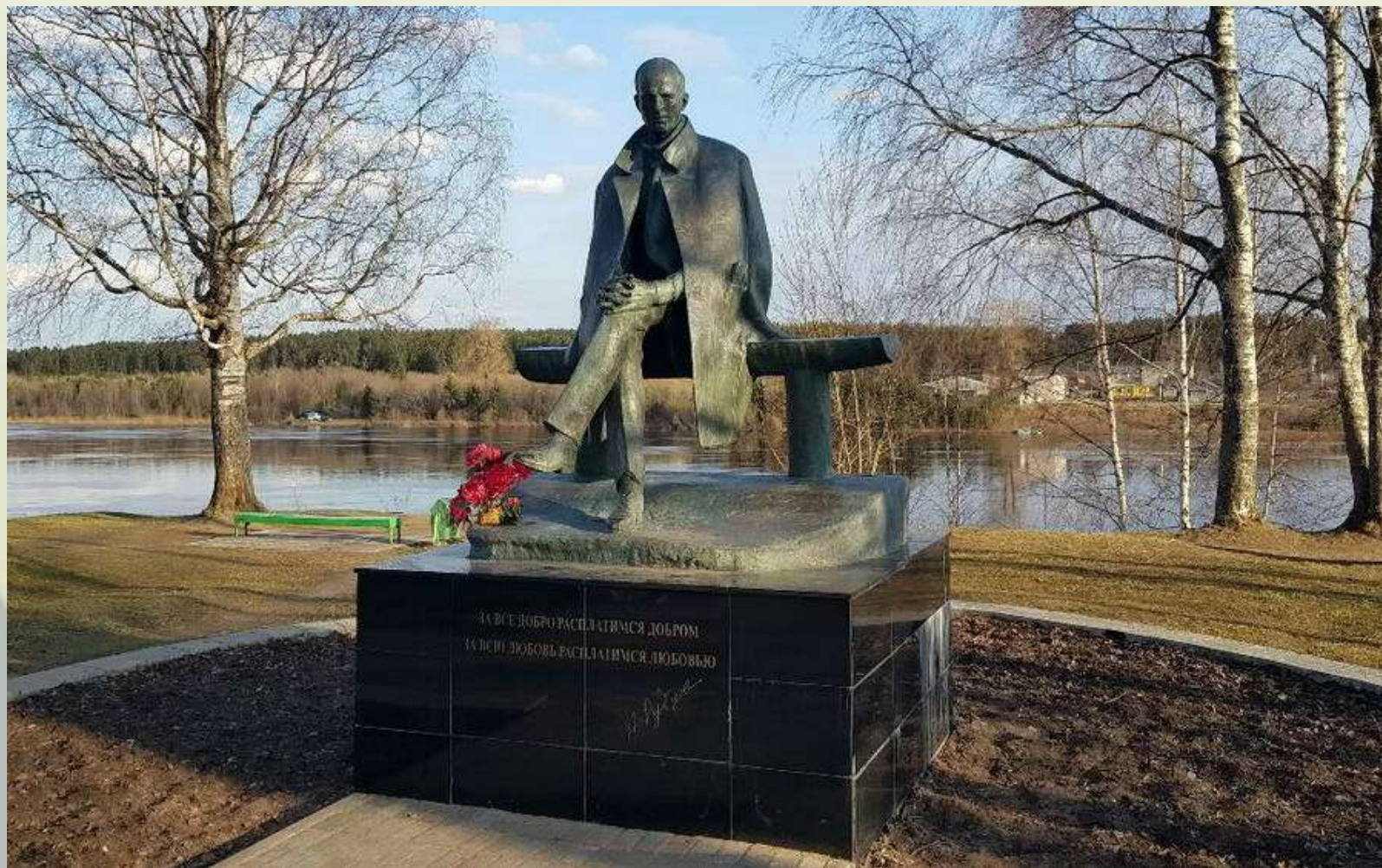
Памятник в Тотьме

В 1985 году, в Тотьме, на берегу реки Сухоны, открыли памятник поэту. Потом памятники поэту появились в Вологде, в Емецке.