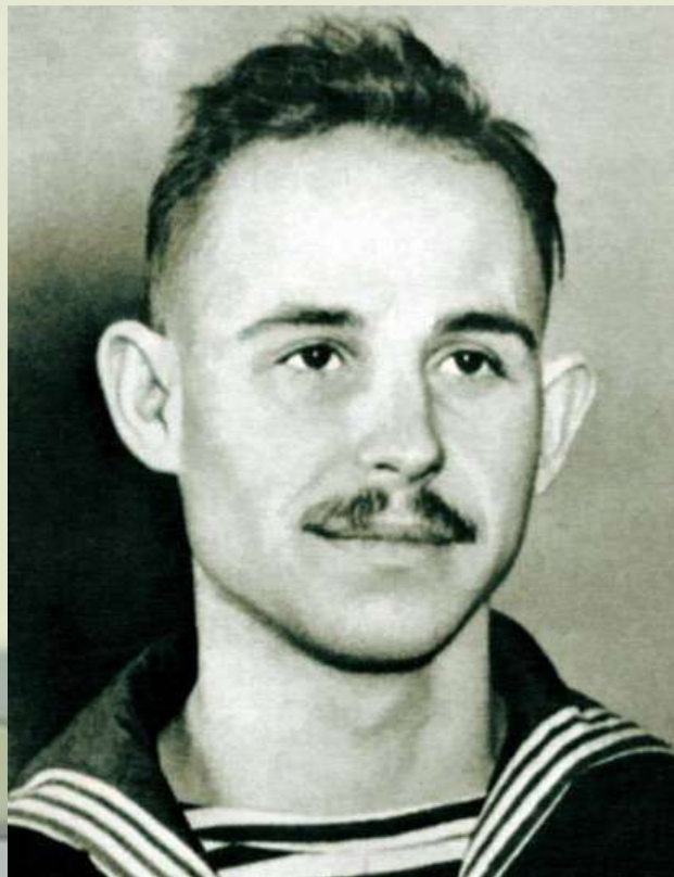
Служба в Северном морском флоте