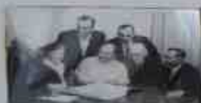
Встреча с замкомандиром Новостреловским, 1950 г.