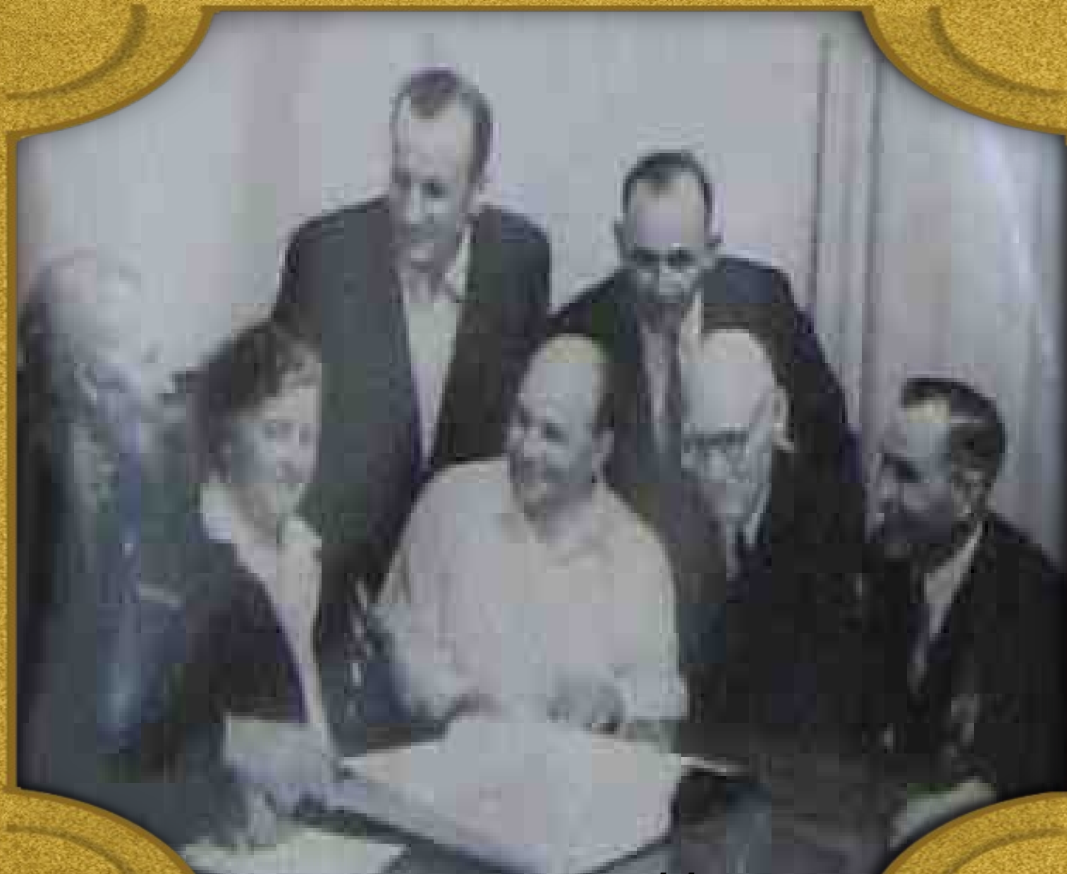
Встреча с земляками ст. Новолеушковская