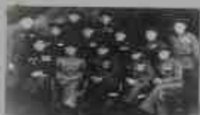
Бойцы 97 отдельной исторической гвардейской авиаполка Чкаловского авиакорпуса, май 1945 г.