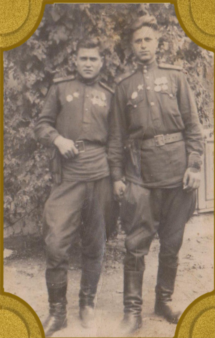
Румыния. 1944 год.