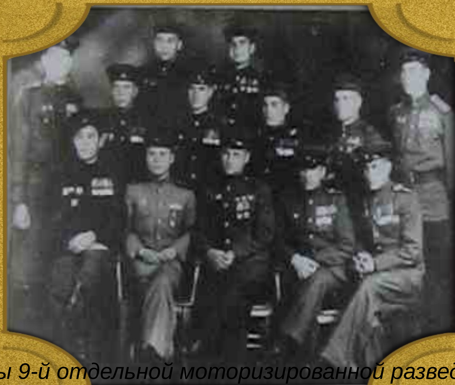
Воины 9-й отдельной моторизированной разведроты после разгрома Японии 1945 год