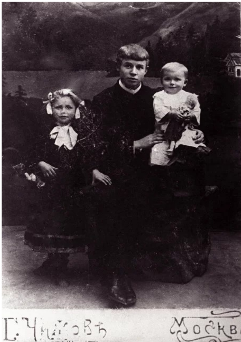
Сергей Есенин с сёстрами