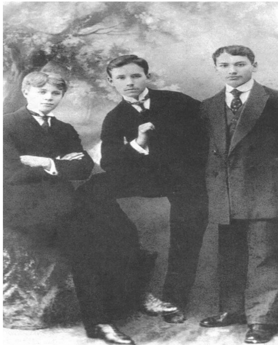
Сергей Есенин с друзьями