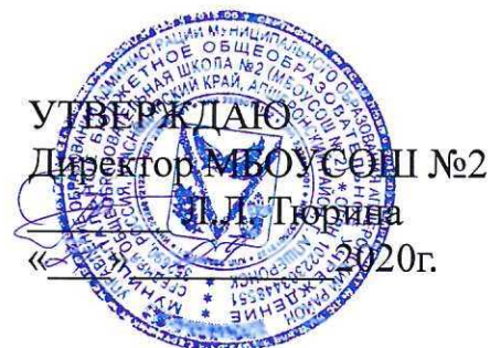
График проведения административных контрольных работ в начальной школе в 2020-2021 учебном году