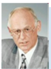
Председатель Попечительского Совета Негосударственного пенсионного фонда «Образование и наука» Бальжники Григорий Артемович — Председатель Комитета Госдумы РФ по образованию